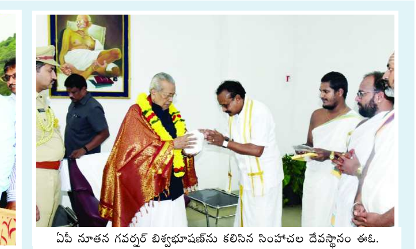
ఏపీ నూతన గవర్నర్ బిశ్వభూషన్ కు కలిసిన సింహచల దేవస్థానం ఈఓ.