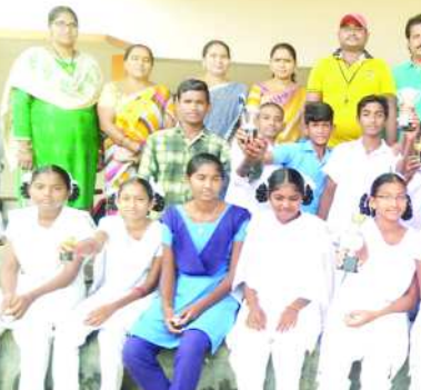
కోటపురట్ల: మండల కేంద్రంలో ప్రభుత్వ హై స్కూల్ లో యందు మూడు రోజుల నుండి జరుగుతున్న మండల స్థాయిలో క్రీడా పోటీల్లో పాములవాక విద్యార్థులు టాప్