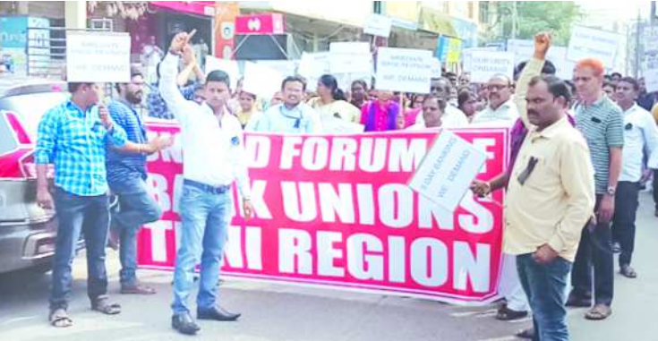
సర్వీపట్నంలో బ్యాంకు ఉద్యోగుల నిరసనలు

నర్సీపట్నం : యునైటెడ్ ఫోరం ఆఫ్ బ్యాంక్ యూనియన్ పిలుపుమేరకు, బ్యాంక్ ఉద్యోగుల ధ్వైపాక్షిక వేతన సవరణ ఒప్పందం ప్రకారం ఖుక్రవారం నర్సీపట్నం పరిసర ప్రాంతాల్లో ఉన్న ప్రభుత్వ బ్యాంకులకు ఉద్యోగులు సమ్మెల్లో పాల్గొన్నారు. గతంలో ఇచ్చిన ఒప్పందం ప్రకారం సవరణ 2017లో ముగియటంతో, వేతన సవరణతోపాటు న్యాయమైన 12 డిమాండ్లు సాధన కోసం దేశవ్యాప్తంగా ఉద్యోగులు, అధికారులు 10 లక్షల మంది రెండు రోజులు అనగా జనవరి 31 మరియు ఫిబ్రవరి 1న సమ్మెల్లో పాల్గొని నిర్ణయించామన్నారు. బ్యాంకు యజమాన్యాల సమాఖ్య (ఐ.బి.ఎ) ఉద్యోగులకు అర్హతమైన వేతన సవరణ చేయుటకు సుముఖముగా లేక పాడం తో బ్యాంకులు నిర్వహణ లాభం పొందుతున్నప్పటికీ, వేలకొట్టు మొండి ఋణాల ఎగతాళి ద్వారా కేటాయింపుల వలన నిఖర సమ్మెలలోకి బ్యాంకులు నెట్టివేయబడుతున్నవి వారు ఆవేదన చెందారు. వేతన సవరణకు బ్యాంకుల లాభాలతో ముడిపెట్టడం అన్యాయమని నూతన పెన్షన్ పంచాలని, బ్యాంకు అధికారకు నిర్దిష్ట పని గంటలుండాలని, కాంట్రాక్టు, ఒప్పంద ఉద్యోగులకు సమాన పనికి సమాన వేతనం కల్పించాలని, డిజిటల్ సేవలు, ప్రత్యేక ఏ.సి.వి.లు వేల సంఖ్యలో ఏటిఎమ్ల ద్వారా సేవలందిస్తుండడం వలన వారికి 5 రోజుల పనిదినాలను కల్పించాలని, అన్ని శాఖలలో ఒకే పనివేళలు కల్పించాలని, స్పెషల్ ఎలవెన్స్ను జేసికెల్లో కలపాలని న్యాయమైన డిమాండ్లతో ఐ.బి.ఎ, గవర్నమెంట్ కి వ్యతిరేకంగా ఉద్యోగులు అధికార నివాదాలు చేశారు. ఈ కార్యక్రమంలో యునైటెడ్ ఫోరం ఆఫ్ బ్యాంక్ యూనియన్ (యు.ఎఫ్.బి.యు) గొలుగండ, నర్సీపట్నం స్టేట్ బ్యాంకు అధికారులు ప్రసాద్, రామకృష్ణ, ఇండియన్ బ్యాంక్ సిబ్బంది యూనియన్ బ్యాంక్ సిబ్బంది ప్రభుత్వ బ్యాంకు ఉద్యోగులు పాల్గొన్నారు.