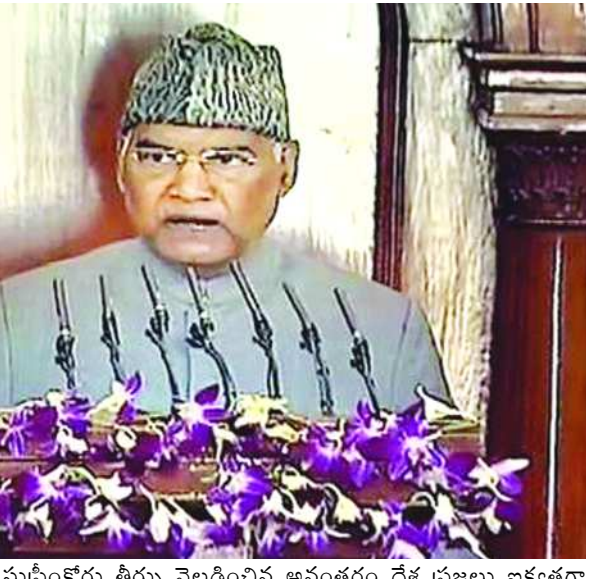
న్యూఢిల్లీ : దేశ ప్రజల ఆకాంక్షలకు అనుగుణంగా ప్రతి ఒక్కరు పనిచేయాలని, ఈ దశాబ్దం భారత్ కు ఎంతో కీలకంగా మారనుందని రాష్ట్రపతి రామ్ నాథ్ కోవింద్ పేర్కొన్నారు.

న్యూఢిల్లీ : దేశ ప్రజల ఆకాంక్షలకు అనుగుణంగా ప్రతి ఒక్కరు పనిచేయాలని, ఈ దశాబ్దం భారత్ కు ఎంతో కీలకంగా మారనుందని రాష్ట్రపతి రామ్ నాథ్ కోవింద్ పేర్కొన్నారు. బడ్జెట్ సమావేశాల సందర్భంగా ఉభయ సభలనుద్దేశించి రాష్ట్రపతి రామ్ నాథ్ కోవింద్ శుక్రవారం ప్రార్థనలో ప్రసంగించారు. ఈ సందర్భంగా కోవింద్ మాట్లాడుతూ.. ప్రభుత్వం నవభారత్ నిర్మాణమే లక్ష్యంగా పనిచేస్తుందని తెలిపారు. పేద ప్రజల సంక్షేమం దృష్టిలో పెట్టుకొని కొత్త పథకాలు ప్రవేశ పెట్టారని పేర్కొన్నారు. త్రిపుల్ తలాక్ వల్ల మైన్యార్టీ మహిళలకు న్యాయం జరిగిందని వెల్లడించారు. ట్రాన్స్ జెండర్ హక్కులను కాపాడేందుకు ప్రభుత్వం కృషి చేస్తుందని వెల్లడించారు. వివాదాస్పద రామజన్మభూమిపై