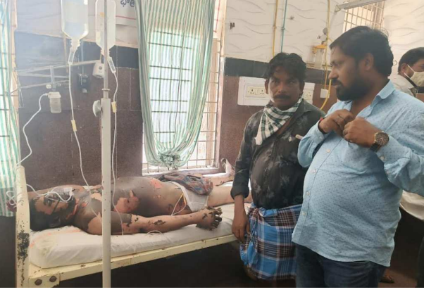
క్షతగాతులను వైద్యం నిమిత్తం ఆస్పత్రికి తరలించడంలో కేసు నమోదు చేసి పోలీసులు దర్యాప్తు చేస్తున్నారు.