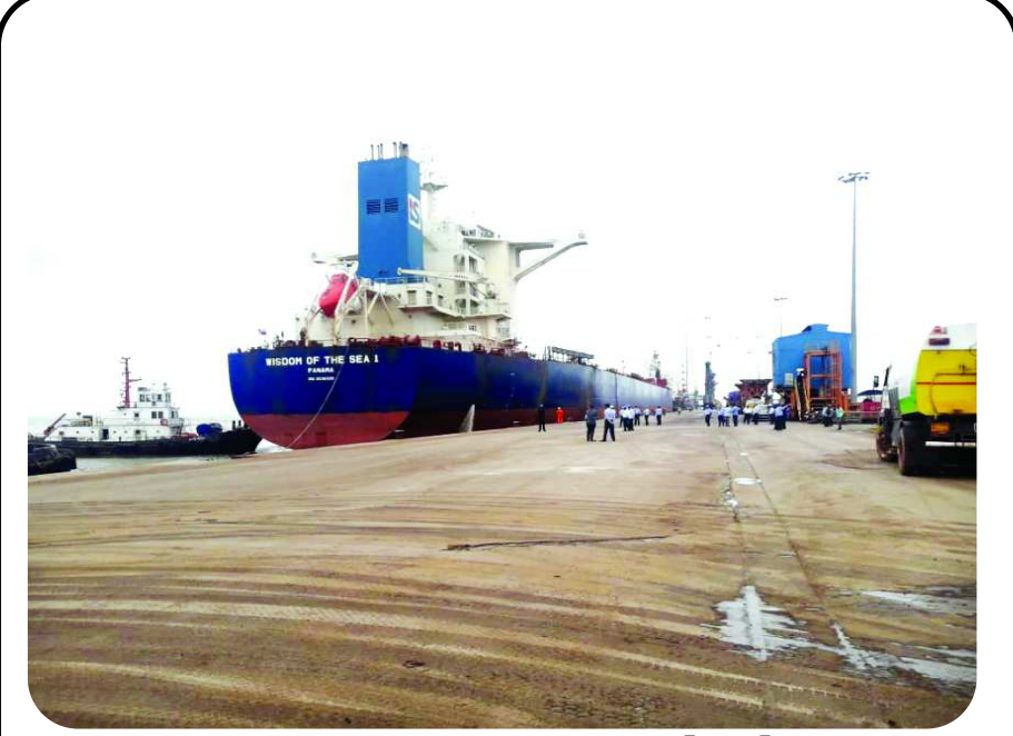
తొలిసారిగా కాకినాడ పోర్టుకు క్యాప్ సైజ్ వెనెల్

తొలిసారిగా కాకినాడ డీప్ వాటర్ పోర్ట్ ఎంపి విజయవంతు పేరుగల ఒక 1,04,000 మెట్రిక్ టన్నుల పరిమాణపు క్యాప్ సైజ్ వెస్సెల్ ను రూపొందించింది. క్యాప్ సైజ్ వెస్సెల్ అతి పెద్ద డ్రెకర్స్ వెస్సెల్ ఆండ్రప్రచేకలోని మైసూర్ పోర్టులన్నీ క్యాప్ సైజ్ వెస్సెల్ ను హ్యాండిల్ చేయగల సామర్థ్యాన్ని కలిగి ఉన్నాయి.