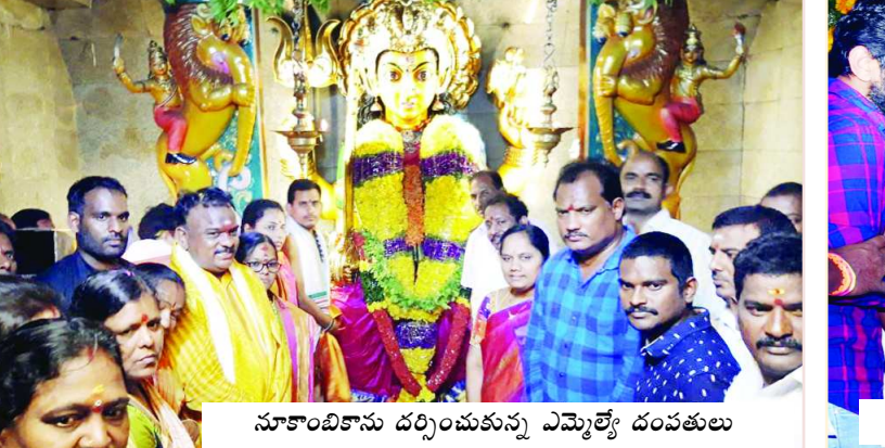
నూకాంబికాను దర్శించుకున్న ఎమ్మెల్యే దంపతులు