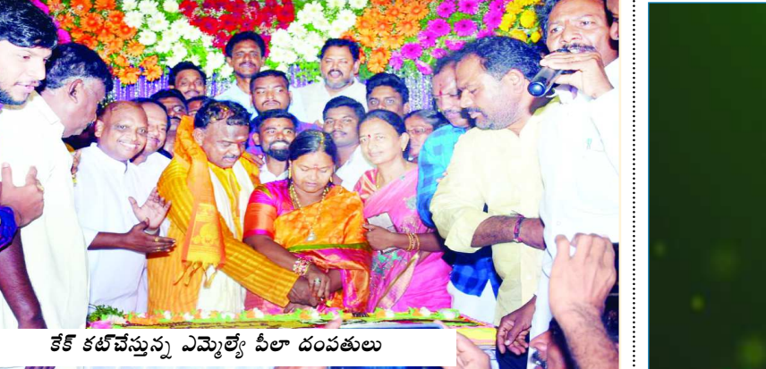
కేక్ కట్ చేస్తున్న ఎమ్మెల్యే పీలా దంపతులు