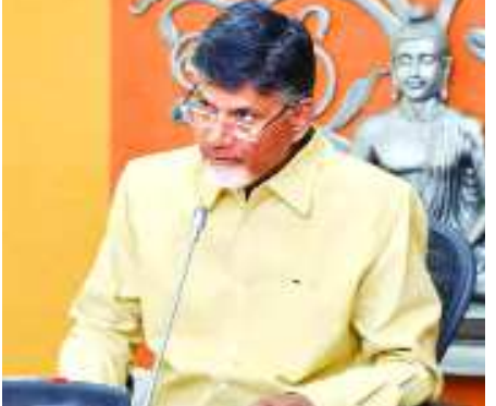
ఆకర్షించేలా రూపుదిద్దుకోవాలని ముఖ్యమంత్రి సూచించారు. స్టార్ హోటల్, కన్వెన్షన్ సెంటర్ నుంచి బీచ్ వరకు కనువిందు కలిగించేలా తరువాయి 2లో..

అమరావతి: లులు అంతర్జాతీయ కన్వెన్షన్ సెంటర్ ఒక వినూత్న రీతిలో అత్యంత ఆకర్షణీయ నిర్మాణంగా రూపొందించాలని ముఖ్యమంత్రి నారా చంద్రబాబు నాయుడు సూచించారు. కన్వెన్షన్ సెంటర్ తో పాటు, 5 స్టార్ హోటళ్లు, విశాలమైన మల్ ఏర్పాటు చేసే ప్రతిపాదనలు, నిర్మాణ డిజైన్లను ముఖ్యమంత్రి సచివాలయంలో పరిశీలించారు. 1500 కోట్ల రూపాయల వ్యయం తో 13.83 ఎకరాల విస్తీర్ణంలో ఈ అంతర్జాతీయ కన్వెన్షన్ కేంద్రాన్ని అభివృద్ధి చేయడానికి లండన్ కు చెందిన డిజైన్ ఇంటెర్నేషన్ అనే ఆర్కిటెక్ట్ సంస్థ వివిధ సమాచారాలను ముఖ్యమంత్రికి వివరించింది. విశాఖపట్నం బీచ్ కు ఎదురుగా ఏర్పాటుకానున్న ఈ ప్రతిష్టాత్మక ప్రాజెక్ట్ ప్రపంచ వ్యాప్తంగా