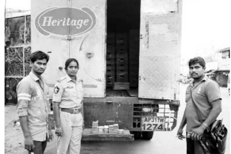
హెరిటేజి డెయిరీ వాహనం నుండి స్వాధీనం పోలీసులు స్వాధీనం చేసుకున్న రూ.1,08,390లు.