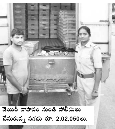
విశాఖ డెయిరీ వాహనం నుండి పోలీసులు స్వాధీనం చేసుకున్న నగదు రూ. 2,02,050లు.