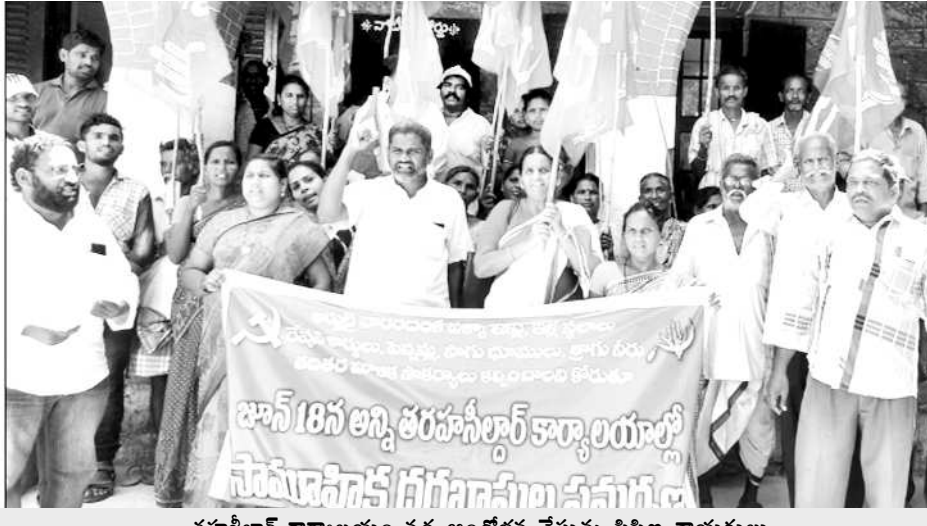
తహశీల్దార్ కార్యాలయం వద్ద ఆందోళన చేస్తున్న సిపిఐ నాయకులు