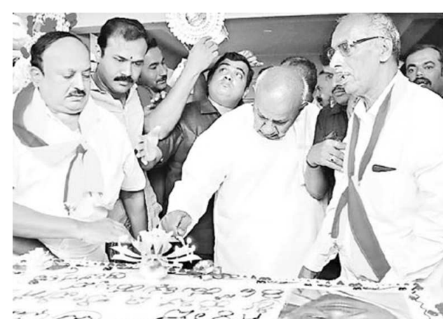
బెంగళూరు : జనతాదళ్ రాష్ట్ర అధ్యక్షుడు కుమార కాలాని ఆకాంక్షించారు.

స్వామి మరోమారు ముఖ్యమంత్రి ఆయన నేపథ్యంలో సువర్ణ కర్ణాటక ఒక్కరిగిరీ హిత్ రక్షణ వేదికే పథాధికారులు ఆదివారం వేడుకలను నిర్వహించారు. ఈ విజయం అపూర్వ ఘట్టంగా పేర్కొన్నారు. మాజీ ప్రధానమంత్రి దేవేగౌడ 86వ పుట్టిన రోజు వేడుకల కొనసాగించుకుంటూ ఈ ఘట్టం వేదికగా నిలిచింది. పద్మనాభనగరంలోని దేవేగౌడ నివాసానికి సంఘం పథాధికారులు ఆదివారం భారీ కేక్ తీసుకువెళ్లి సంబరాలు ప్రారంభించారు. దేవేగౌడ స్వయంగా కేక్ కోసి, సంఘం పథాధికారులకు పంచి పెట్టారు.