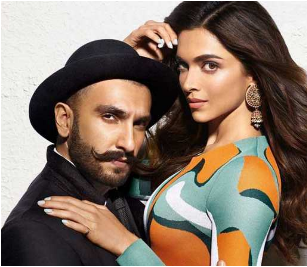
రాజోంది. ఈ సినిమా విడుదల తర్వాత రణవీర్, దీపిక హానిమూన్ వెళ్లడం అవకాశం ఉంది. దీపిక పదుకోన్ దీపిక పదుకోన్ త్వరలో మేఘనా గుల్జార్ దర్శకత్వంలో తెరకెక్కబోయే చిత్రంలో

రణవీర్ సంగ రణవీర్ సింగ్ ప్రస్తుతం రోహిత్ శెట్టి దర్శకత్వంలో నటించిన 'సింబా' మూవీకి సంబంధించిన ప్రమోషన్లలో బిజీగా ఉన్నారు. ఈ చిత్రం డిసెంబర్ 28న ప్రేక్షకుల ముందుకు