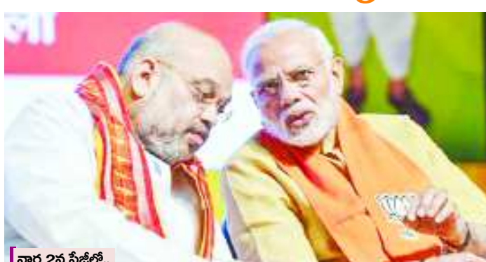
వార్త 2వ పేజీలో..