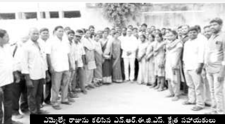
ఎమ్మెల్యే రాజును కలిసిన ఎన్.ఆర్.ఈ.జి.ఎస్. క్షేత్ర సహాయకులు

చోడవరం : మహాత్మా గాంధీ జాతీయ గ్రామీణ ఉపాధి హామీ పథకంలో పని చేస్తున్న క్షేత్ర సహాయకులను రెగ్యులర్ చేయడంలో స్థానిక ఎమ్మెల్యే చేసిన కృషికి సిబ్బంది ధన్యవాదములు తెలియజేశారు. ఈ సందర్భంగా శనివారం ఎమ్మెల్యే క్యాంపు కార్యాలయంలో చోడవరం ఎమ్మెల్యే కె.ఎస్.ఎస్.ఎస్.రాజును నాలుగు మండలాల వీఆర్సీలు కలిసారు. వీఆర్సీ సంఘ అధ్యక్ష, కార్యదర్శులు బోడి రాజు, శరగడం రాములు మాట్లాడుతూ జాతీయ గ్రామీణ ఉపాధి హామీ పథకంలో పనిచేస్తున్న 288 మంది క్షేత్ర సహాయకులను ఫిక్సిడ్ టెన్యూర్ ఉద్యోగులుగా గుర్తిస్తూ సంబంధిత పంచాయితీరాజ్ శాఖ మంత్రి నారా లోకేశ్ తీసుకున్న నిర్ణయంతో 12 వేల మంది క్షేత్ర సహాయకులు లబ్ధి పొందనున్నట్లు తెలియజేశారు.