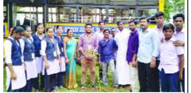
కళాశాలలో మొక్కలు నాటుతున్న దృశ్యం