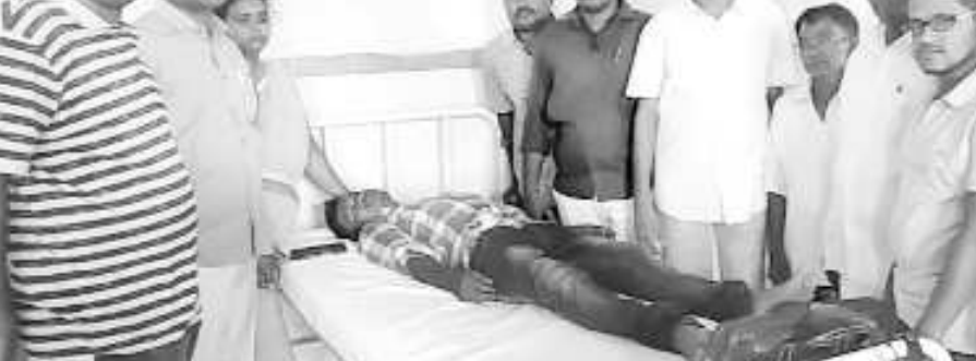
విఆర్ఎస్ పరామర్శిస్తున్న నాయకులు