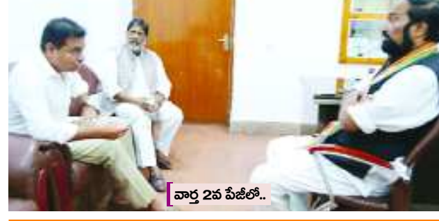
వారా 2వ పేజీలో..