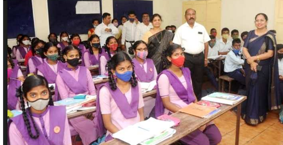
పాఠశాలలో ప్రాక్టికల్స్ను పర్యవేక్షిస్తున్న అధికారులు