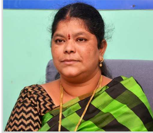
ఉన్నందున చెట్ల కింద ఎవరూ ఉండరాదని, గెడ్డలు, కాలువలు, లోతట్టు ప్రాంతాలు వరద సంభవించే అవకాశం ఉన్నందున ప్రజలు అప్రమత్తంగా ఉండాలని సూచించారు.

విశాఖపట్నం (విజయభాను న్యూస్) : "జావేద్" తుఫాన్ కారణంగా లోతట్టు ప్రాంత ప్రజలు, నగరవాసులందరూ అప్రమత్తంగా ఉండాలని నగర మేయర్ గొలగాని హరి వెంకట కుమారి పత్రికా ప్రకటన ద్వారా తెలిపారు. కొండవాలు ప్రాంత ప్రజలు, లోతట్టు ప్రాంత ప్రజలు అప్రమత్తంగా ఉండి ఎటువంటి అవాంఛనీయమైన సంఘటనలు ఎదురైన యెడల టోల్ ఫ్రీ నెంబర్ 1800 4250 0009 లేదా 0891 -2869106కు తెలియపరచాలని కోరారు. జివిఎస్ అధికారులు, సిబ్బంది నగరంలో ఉండి ఎటువంటి విపత్తులైనను ఎదుర్కొనేందుకు సిద్ధంగా ఉండాలని, అవసరమైతే ముందస్తు చర్యగా పునరావాస కేంద్రాలను ఏర్పాటు చేసే ముప్పు ప్రాంత ప్రజలు, కొండవాలు ప్రాంత ప్రజలను కేంద్రాలకు తరలించేందుకు సిద్ధంగా ఉండాలని అధికారులు, సిబ్బంది ఆదేశించారు. ఇప్పటికే అధికారులను అప్రమత్తం చేశామని తెలిపారు. నగరంలో పెను గాలులు వీచే అవకాశం