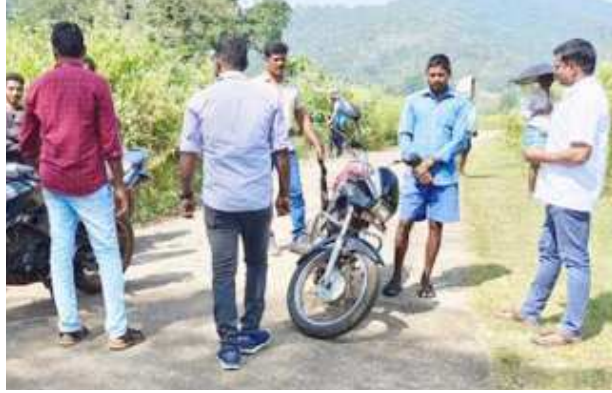
తనిఖీలు నిర్వహిస్తున్న దృశ్యం