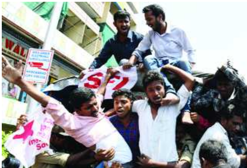
హైదరాబాద్: తెలంగాణ ఇంటర్ ఫలితాల్లో అవకతవకలపై నిరసనలు కొనసాగుతున్నాయి. ఇంటర్ బోర్డు తీరుకు నిరసనగా ప్రగతిభవన్ ముట్టడికి ఎన్ఎఫ్ఐ యత్నించింది. ఈ నేపథ్యంలో ప్రగతిభవన్ వద్ద పోలీసులు భారీగా మోహరించారు. ప్రగతిభవన్ వైపు దాసుశెట్టి ఆందోళనకారులను పోలీసులు అదుపులోకి తీసుకున్నారు. దీంతో ఇక్కడ పరిస్థితి ఉద్రిక్తంగా మారింది.