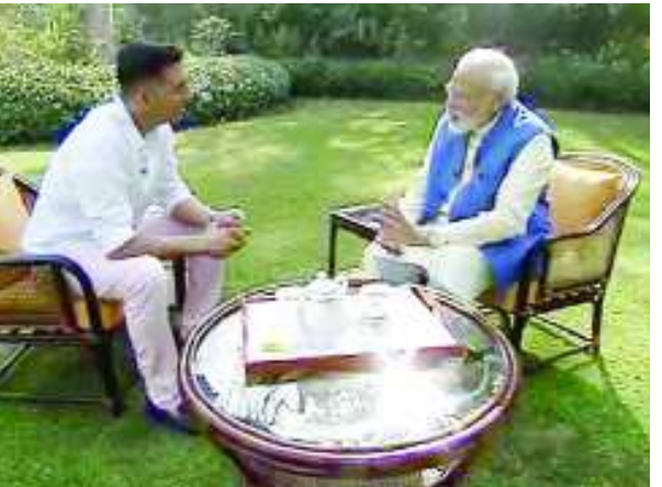
పెద్దపెద్ద వాళ్లను కలవడం కంటే.. చిన్న పిల్లలను కలవడమే చాలా కష్టం. రామకృష్ణ మిషన్ నాకు స్ఫూర్తి. భావోద్వేగాలను అదుపులో ఉంచుకుంటా. నేను అందరితో సరదాగా గడపాలని భావిస్తాను. అధికారులందరికీ నేను ఓ స్నేహితుడిని. రాజకీయాల కంటే ఇతర విషయాలపై ఎక్కువగా ఆసక్తి ఉంటుంది. వివేక నేతల్లో చాలా మంది స్నేహితులు ఉన్నారు. సూర్య సమయంలో బ్యాంక్ ఖాతా తెరిచినా డబ్బులు వేయలేదు. 32 సంవత్సరాలు జీవో బయోగ్రఫీలు చదవడం అంటే నాకు చాలా ఇష్టం. తరువాతి 2లో..

న్యూఢిల్లీ: "నేను ప్రధాన మంత్రి అవుతానని అసలు ఊహించలేదు. ప్రధాని కావాలని నేనెప్పుడూ కలగనలేదు. కుటుంబ ప్రమేయంతో అనుకోకుండా రాజకీయాల్లోకి వచ్చాను. సైన్యంలో చేరి దేశసేవ చేయాలనుకున్నా. నేను క్రమశిక్షణ గల కార్యకర్తను. నేనే కఠినంగా ఉంటాను. ప్రజల్ని ఇబ్బంది పెట్టాలని మాత్రం అనుకోను." అని భారత ప్రధాని నరేంద్రమోదీ పేర్కొన్నారు. 7లోక కల్యాణ్ మార్గంలో ప్రధాని నరేంద్రమోదీతో బాలీవుడ్ నటుడు అక్షయ్ కుమార్ ముఖాముఖీ కార్యక్రమం నిర్వహించారు. పూర్తిగా రాజకీయాలకు సంబంధం లేని ఆంశాలపై చర్చించారు. ఈ సందర్భంగా అక్షయ్ కుమార్ అడిగిన ఆసక్తికర ప్రశ్నలకు మోదీ సమాధానాలిచ్చారు.