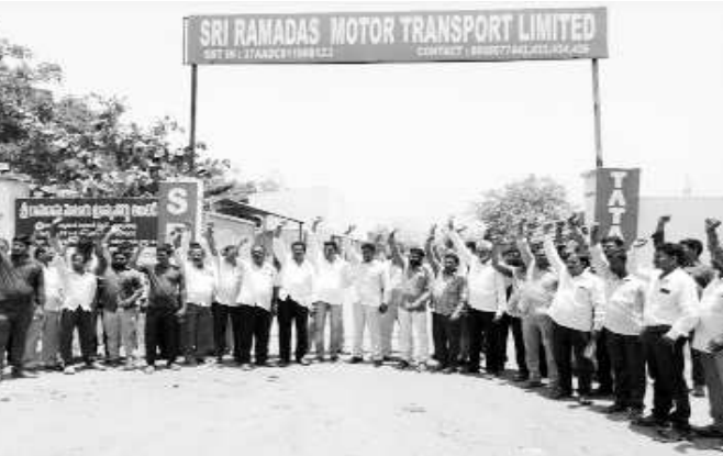
మద్దతుకోరి రాష్ట్రవ్యాప్త పోరాటం నిర్వహిస్తున్న హెచ్చరించారు. ఈ నిరసన కార్యక్రమంలో లారీ యజమానులు సంఘం ప్రతినిధులు, పలువురు డ్రైవర్లు తదితరులు పాల్గొన్నారు.

గాజువాక: తయారీ లోపం కారణంగా వచ్చే ఇంజన్ లోపాలకు కంపెనీ యజమానుల బాధ్యత వహించాలని అసకాపల్లె లారీ యజమానుల సంఘం సభ్యులు డిమాండ్ చేశారు. బుధవారం ఆటోనగర్ లోని ఎస్ఆర్ఎంబి వారంతా ధర్నా నిర్వహించారు. ఈ సందర్భంగా వారు మాట్లాడుతూ నాణ్యత లేని తయారీ కారణంగా లారీలు కొన్ని ఆరునెలలకే మూలకు చేరి పరిస్థితులు ఉన్నాయని అయితే వాహనాల అమృతం సమయంలో ఆరు సంవత్సరాల వారంటీ అని చెప్పి ఇప్పుడు వారంటీ లేదంటూ మాటూరుస్తున్నారని ఆవేదన వ్యక్తం చేశారు. కంపెనీ యజమాన్యం తీరుతో లారీ యజమానులు లక్షలాది రూపాయలు నష్టపోవాల్సి వస్తుందని ఇప్పటికైనా కంపెనీ యజమాన్యం స్పందించి న్యాయం చేయకపోతే వినియోగదారుల కోర్టుకు వెళ్ళేందుకు సిద్ధమని పేర్కొన్నారు. ఇప్పటికే తమకు విశాఖ జిల్లా లారీ ఓనర్ల అసోసియేషన్ కూడా మద్దతుగా నిలిచిందని, అసనరమైతే రాష్ట్రవ్యాప్తంగా ఉన్న అన్ని లారీ యజమానులు సంఘాల