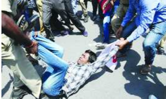
మరోవైపు ఇంటర్ బోర్డు ముట్టడికి డీవైఎఫ్ వై విద్యార్థి సంఘం, గ్లోబరీస్ టెక్నాలజీ సంస్థ ముట్టడికి సీపీఐ పిలుపు నిచ్చాయి. దీంతో వాతావరణం ఒక్కసారిగా వేడెక్కింది. విద్యార్థులు, వారి తల్లిదండ్రులకు తరువాతి 2లో..