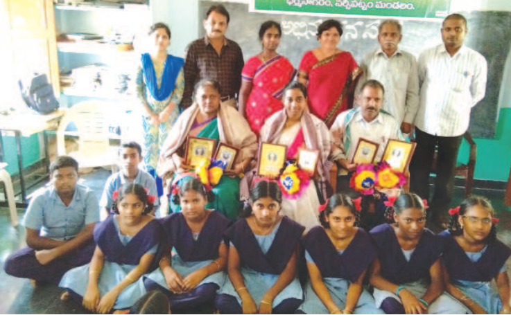
ఉపాధ్యాయులను సన్మానిస్తున్న ఎంపీపీ తదితరులు

ఎంపీపీ సుకల రమణమ్మ నర్సేపట్నం : నర్సేపట్నం మండలం ధర్మసాగరం పాఠశాలను అప్ గ్రేడ్ చేసేందుకు ప్రయత్నం చేస్తానని ఎంపీపీ సుకల రమణమ్మ అన్నారు.