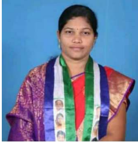
లు, డైరెక్టర్ లు, పార్టీ అభిమానులు, కార్యకర్తలు, అందరూ హాజరై విజయవంతం చేయాలని ఒక ప్రకటనలో విలేకరులకు తెలియపరిచారు.