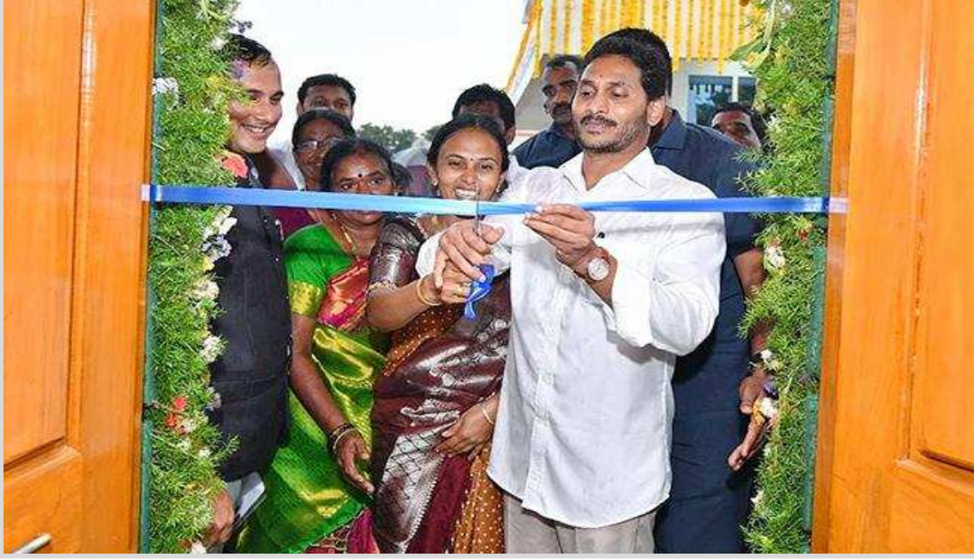
వేల్పులలో సచివాలయ కాంప్లెక్స్ను ప్రారంభించిన సీఎం వైఎస్ జగన్ అనంతరం సచివాలయ కాంప్లెక్స్ సముదాయాన్ని సీఎం వైఎస్ జగన్ పరిశీలించారు. వేల్పులలో ఒక ప్రాంగణంలో అన్ని ప్రభుత్వ సంక్షేమ భవనాలు. వేముల మండలంలోని వేల్పుల గ్రామ సచివాలయ కాంప్లెక్స్ను సీఎం వైఎస్ జగన్ ప్రారంభించనున్నారు. ముఖ్యమంత్రి వైఎస్ జగన్మోహన్రెడ్డి జిల్లాలో మూడు రోజులపాటు పర్యటించనున్నారు. ఈ క్రమంలో సీఎం జగన్ వైఎస్సార్ జిల్లా పర్యటనకు బయల్దేరారు. వైఎస్సార్ జిల్లాలో సెప్టెంబరు 1 నుంచి 3వ తేదీవరకు ముఖ్యమంత్రి వివిధ కార్యక్రమాల్లో పాల్గొనున్నారు.

ప్రిలిమ్స్ ప్రాథమిక పరీక్షను ప్రాంతీయ భాషల్లో నిర్వహించేలా మూడాలని అభ్యర్థులు యూపీఎస్సీ, కేంద్ర ప్రభుత్వాలను కోరుతున్నా సరైన స్పందన ఉండటంలేదు. ఈ విషయంలో తమిళనాడు ప్రజాప్రతినిధుల చొరవ మెచ్చు కోదగినది. సివిల్ అభ్యర్థుల కోసం పలుమూర్తి అసెంబ్లీ, పార్లమెంటులో వారు గళం వినిపించారు. తెలుగు రాష్ట్రాలతో పాటు ఇతర ప్రాంతాల్లోని ప్రభుత్వాలు, ప్రజా ప్రతినిధులు సైతం ఈ విషయంలో స్పందించాలి. ప్రసార మాధ్యమాల్లోనూ దానిపై విస్తృతంగా చర్చ జరగాల్సిన అవసరం ఉంది. ఆయా రాష్ట్రాల నుంచి అఖిల భారత స్థాయి అధికారులుగా అనేక మంది ప్రతిభావంతులు ఎదగడానికి ఆస్కారం ఉంది. అలాంటి వారికి సివిల్ పరీక్షలకు అవసరమైన వైపుజ్యాలను అందించడానికి ప్రభుత్వాలు చొరవ తీసుకోవాలి. వారికోసం అవసరమైన శిక్షణా సంస్థలను గ్రామీణ ప్రాంతాల్లో ఏర్పాటు చేయడంపై దృష్టి సారించాలి. ప్రాంతీయ భాషల్లో నాణ్యమైన పాఠ్య సామగ్రిని అందు బాటులోకి తెవడమూ అత్యంత కీలకం. కేవలం యూపీఎస్సీనే కాకుండా స్టాఫ్ సెలక్షన్ కమిషన్ (ఎస్ఎస్సీ) తదితర పరీక్షలనూ ప్రాంతీయ భాషల్లో నిర్వహించాలి. ఉపాధి, ఉద్యోగం పొందడంలో ప్రాంతీయ భాష ఎన్నటికీ అవరోధం కాకూడదని రాజ్యాంగం చెబుతోంది. ఆ అంశాన్ని గుర్తించి స్థానిక భాషల్లో పోటీ పరీక్షలను నిర్వహించి రాజ్యాంగం స్ఫూర్తిని కాపాడాలి అవసరం ఉంది.