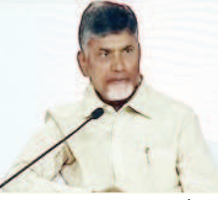
అమరావతి: వైకాపా రెచ్చగొడుతున్న తీరుపై ప్రజలు అప్రమత్తంగా ఉండాలని ఆంధ్రప్రదేశ్ ముఖ్యమంత్రి చంద్రబాబు నాయుడు విజ్ఞప్తి

చేశారు. తెలుగుదేశం పార్టీ ముఖ్య నేతలు, సమన్వయ కమిటీ సభ్యులతో ఆయన సమావేశం నిర్వహించారు. ఈ ఫేజీలో ఆయన మాట్లాడుతూ.. ప్రతిపక్ష వ్యెకాపా ఎన్నికలు వాయిదా వేయించాలని చూస్తోందని అన్నారు. ఓటమి భయంతో శాంతిభద్రతల సమస్య సృష్టించేందుకు ఆ పార్టీ యత్నిస్తోందని.. ఇందుకు సంబంధించిన పక్కా సమాచారం తన వద్ద ఉందని వ్యాఖ్యానించారు. కులం, మతం, ప్రాంతం పేరుతో విద్యేపాలు రెచ్చగొట్టే ప్రయత్నం జరుగుతోందని ముఖ్యమంత్రి సమన్వయ కమిటీ సభ్యులతో అన్నట్లు తెలుస్తోంది. ఇందుకు అనుగుణంగా పార్టీ కార్యకర్తలు పనిచేయాలని