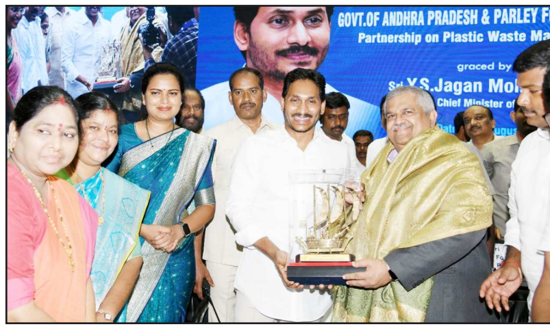
కాత్ ఫైక్ల దిశగా..

విశాఖపట్నంలో పార్టీ పూర్వక ఇనిస్టిట్యూట్ విశాఖపట్నంలో పార్టీ పూర్వక ఇనిస్టిట్యూట్ రాబోతుంది. ఇది దేశంలోనే కాదు ప్రపంచానికే దిక్పావిగా తయారవుతుంది. అత్యాధునిక పద్ధతుల్లో కొత్త మెటీరియల్స్ కనుక్కంటారు. దానికి సంబంధించిన పరిశోధన ఇక్కడ జరుగుతుంది. అదే విధంగా ప్లాస్టిక్ వ్యర్థాలతో బూట్లు, అద్దాలు వంటి మెటీరియల్ తయారు చేసే రీసైకింగ్ మరియు అప్ సైకింగ్ హబ్ కూడా ఏపీలో ఏర్పాటువుతోంది. దీని వల్ల రానున్న ఆరోళ్లలో రూ.16వేల కోట్ల పెట్టుబడులు ఆంధ్రప్రదేశ్ రాష్ట్రానికి రానున్నాయి. అంతే కాకుండా స్థానికంగా ఉద్యోగాలు కల్పన ఒక అంశం అయితే మరొక అంశం రాష్ట్ర వ్యాప్తంగా 20 వేల మందికి ఉద్యోగాలు వస్తాయి. వాళ్లందరూ ఇందులో భాగస్వాములవుతారు. అతిముఖ్య ఆంధ్రరాష్ట్రంలో ప్లాస్టిక్ ను నిర్మూలించే కార్యక్రమానికి శ్రీకారం చుడుతున్నాను.