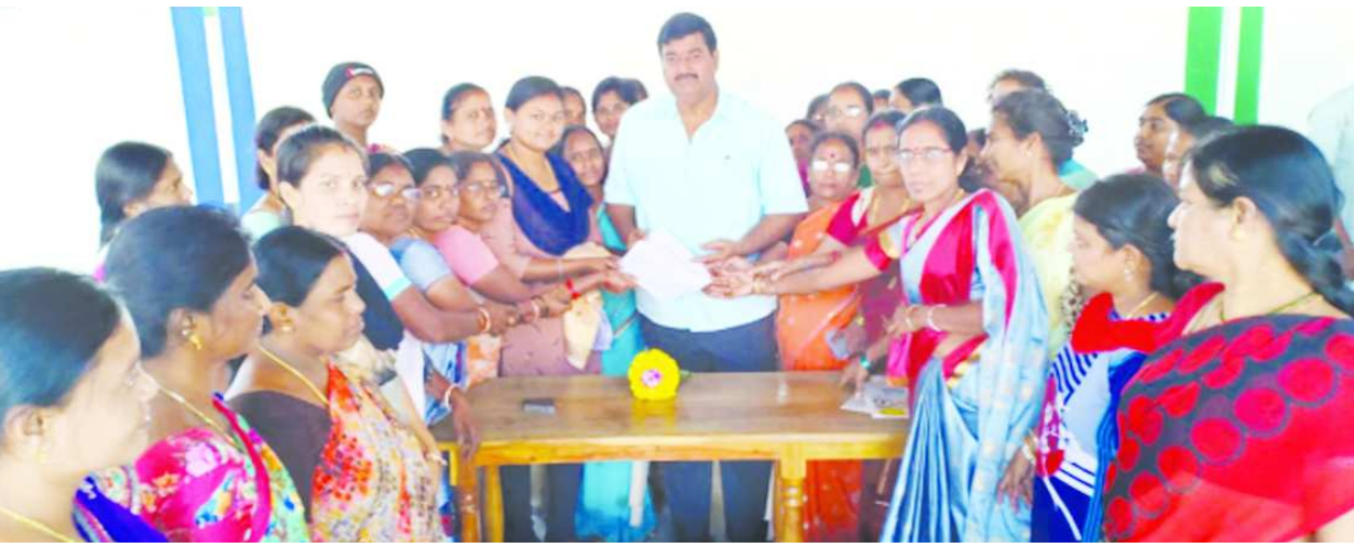
తమకు ఉద్యోగ భద్రత కల్పించాలని కోరుతూ శ్రీకాకుళం నగరపాలక సంస్థ పరిధిలో పట్టణ పేదరిక నిర్మూలన సంస్థ (మెప్పా)లో పని చేస్తున్న రిటైర్డ్ పర్సన్లు గౌరవ మంత్రివర్యులు ధర్మాన కృష్ణదాస్ ని నరసన్నపేటలో బుధవారం కలిశారు. 40 ఏళ్ల పైబడి, 10వ తరగతి ఫియలైన వారి వివరాలు సేకరించమని ఇటీవల ప్రభుత్వం నుంచి వచ్చిన సర్కూలర్ తమలో భయాందోళన కలిగిస్తోందన్నారు.