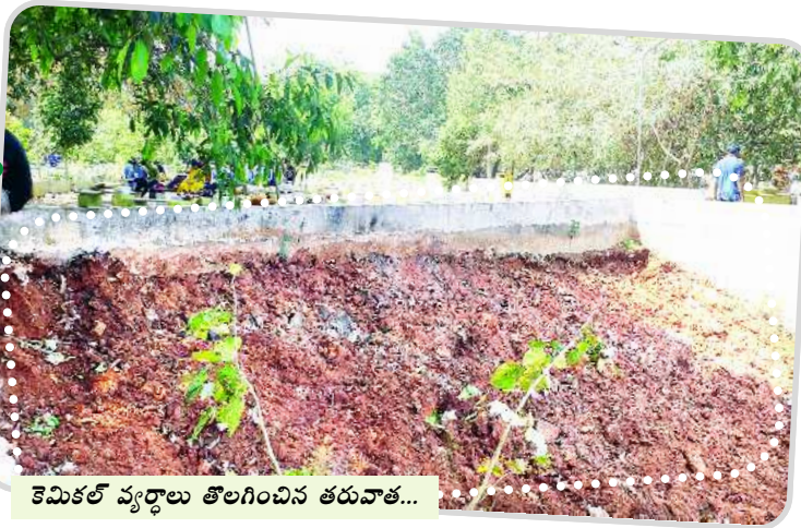
కెమికల్ వ్యర్థాలు తొలగించిన తరువాత...

విశాఖ సిటీ : ప్రతిష్టాత్మకమైన ఆంధ్రా యూనివర్సిటీ ఇంజనీరింగ్ గ్రౌండ్ మైదాన ప్రాంతంలో (విద్యార్థులు స్టడీ సర్కిల్, వాకింగ్ ట్రాక్) ఏయూ కెమికల్ ఇంజనీరింగ్ విభాగం, ఇంజనీరింగ్ కెమిస్ట్రీ ల్యాబ్ యొక్క వ్యర్థాలను ఇంజనీరింగ్ గ్రౌండ్ పరిసర ప్రాంతాలలో ఆరుబయలు బహిరంగ ప్రదేశంలో పడవేయడంతో వ్యర్థాలనుంచి వెలువడే దుర్బంధంభరితమైన విషవాయువులు వెలువడడంతో విద్యార్థులకు ఇబ్బందులు కలుగుతున్నాయంటూ ఈ నెల 25వ తేదీన విజయభాను దినపత్రికలో 'ఏయూ ప్రతిష్టకు ప్రాణాంతకంగా మారిన కెమికల్ విభాగం అనే వార్త పూర్తి ఆధారితో ప్రచురించిన విషయం విదితమే. ఈ వార్తకు స్పందించిన ఏయూ పైఅధికారులు సంబంధిత