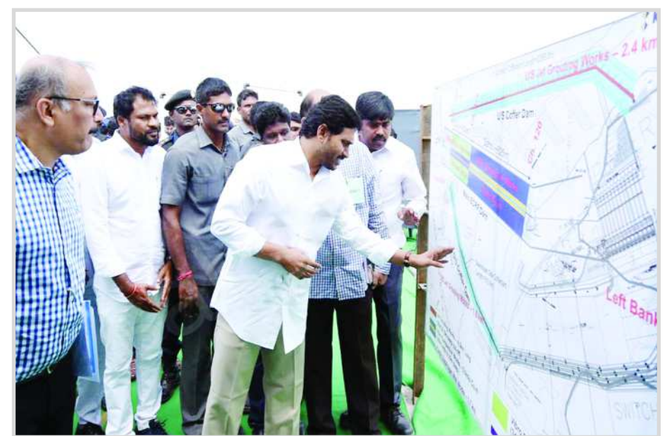
2021 సీజన్ కు ప్రాజెక్టు అందుబాటులోకి తీసుకువస్తే ప్రయోజనకరంగా ఉంటుందని సీఎం వైఎస్ జగన్ తెలిపారు. దీనివల్ల పంటలకు నీటిని అందించే వీలుంటుందని చెప్పారు. గతంలో ప్రణాళిక లోపం, సమన్వయ లోపం, సమవారం లోపం ఉందని గుర్తుచేశారు. దీనివల్ల గత సీజన్ ను కోల్పోయామని.. ఈ సారి అలాంటి పరిస్థితి రాకూడదని ఆదేశించారు. జూన్, జూలై, ఆగస్టు, సెప్టెంబర్, అక్టోబర్ నెలల్లో కూడా ప్రాజెక్టు పనులు జరగాలని తెలిపారు. పనులు జరగడానికి ఉన్న అడ్డంకులపై దృష్టిపెట్టాలని అధికారులకు సూచించారు. ఎట్టి పరిస్థితుల్లోనూ స్టిల్ వే పనులు జూన్ కల్లా పూర్తి కావాలని, అదే వేగంతో అప్రోచ్ ఛానల్ కూడా పూర్తి చేయాలని ఆదేశాలు జారీ చేశారు. జూన్ నాటికి స్టిల్ వేను అందుబాటులోకి తీసుకువస్తే.. నదిలో నీటిని స్టిల్ వే మీదుగా తరలించే అవకాశం ఉంటుందన్నారు.

పోలవరం పనులపై సీఎం సమీక్ష స్టిల్ వే పనులు పూర్తి కావాలి. అధికారులకు సీఎం జగన్ మార్గనిర్దేశనం