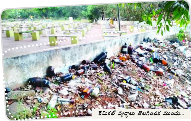
కెమికల్ వ్యర్థాలు తొలగించక ముందు...