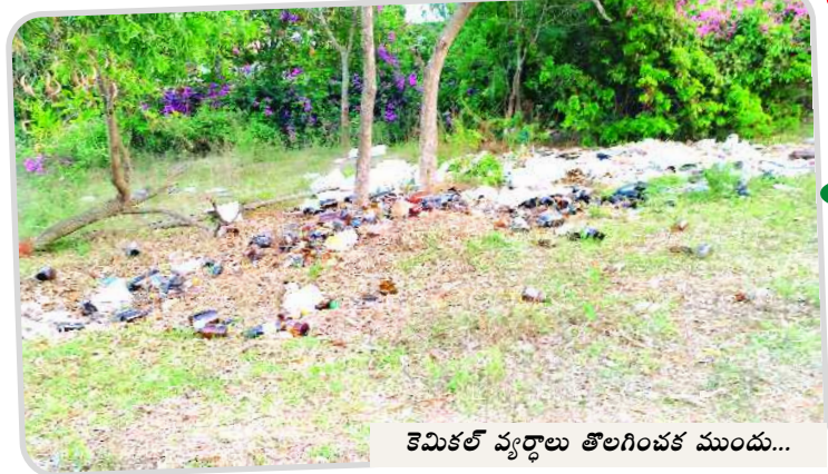
కెమికల్ వ్యర్థాలు తొలగించక ముందు...