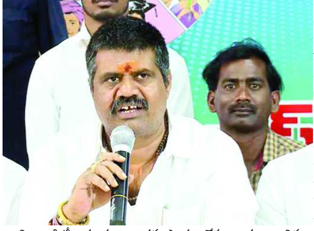
విశాఖ సీట్: చంద్రబాబు తన స్వార్థం కోసం ధంగా విమానాశ్రయానికి వచ్చి ప్రతిపక్షనేతను ప్రాంతీయ విద్వేషాలు రెచ్చగొడుతున్నారని మంత్రి అడ్డుకున్నారని తెలిపారు. పోలీసులు