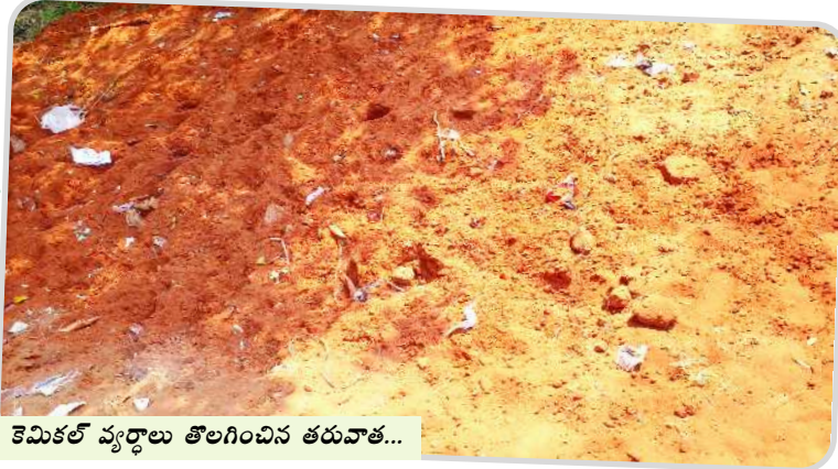
కెమికల్ వ్యర్థాలు తొలగించిన తరువాత...