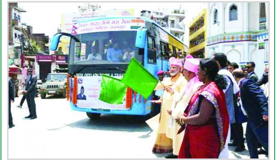
నేపాల్ : కర్ణాటక ఎన్నికల ప్రచారం ముగియగానే ప్రధానమంత్రి నరేంద్ర మోదీ పర్యటన నిమిత్తం నేపాల్ వెళ్లారు. రెండు రోజుల నేపాల్ పర్యటనలో ఆయన అక్కడి మూడు నేపాల్ ప్రధాని కేపీ శర్మ ఓలితో కలిసి మోదీ హిందూ తీర్థాలయాలను సందర్శించనున్నారు. జెండా ఊపి నేపాల్- తరువాయి 2లో