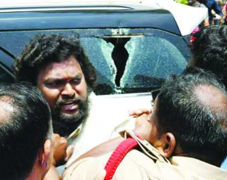
తిరుమల : భాజపా జాతీయాధ్యక్షుడు అమిత్ షా తిరుమల పర్వతం నేపథ్యంలో నిరసనకారులు ప్రత్యేక హోదా కోరుతూ ఆందోళనకు దిగారు. అలిపిరి వద్ద నిరసనకు దిగి... అమిత్ షా గోబ్యాక్ అంటూ నినాదాలు చేశారు. ఏపీకి ప్రత్యేక తరువాయి 2లో

అమిత్ షాకు తిరుపతిలో నిరసనల సెగ • గో బ్యాక్ అంటూ నినాదాలు.. • కాన్వాయ్ పై రాళ్ల దాడి • పోలీసుల అదుపులో నిందితుడు