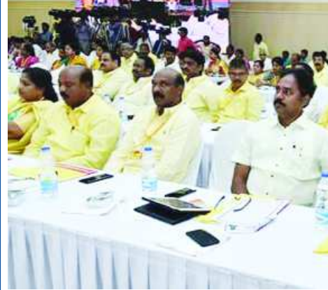
అమరావతి: ఇన్నోవేషన్ వ్యాళికి కేరాఫ్ ఆర్డర్ గా ఏపీని మార్చేందుకు కృషిచేస్తున్నామని ముఖ్యమంత్రి చంద్రబాబు వ్యాఖ్యానించారు. శుక్రవారం ప్రారంభమైన బీజేపీ విస్తృతస్థాయి సమావేశంలో ఆయన మాట్లాడుతూ యువ పారిశ్రామికవేత్తలను ప్రోత్సహిస్తున్నామని అన్నారు. రైతులను అన్ని విధాలా ఆదుకుంటున్నామని చంద్రబాబు చెప్పారు. రాష్ట్ర విభజన జరిగిన మూడు నెలల్లోనే విద్యుత్ కొరత

సమస్యను అధిగమించామన్నారు. విద్యుత్ వార్తలు పెంచబోమని ప్రకటించిన మొదటి రాష్ట్రం ఆంధ్రప్రదేశ్ అని ఆయన గర్వంగా చెప్పారు. అన్ని గ్రామాల్లో సీపీ రోడ్ల నిర్మాణం చేపట్టమని ముఖ్యమంత్రి పేర్కొన్నారు. బీజేపీకి అనుకూలంగా వైసీపీ ప్రచారం: చంద్రబాబు బీజేపీకి అనుకూలంగా వైసీపీ ప్రచారం చేసిందని, బీజేపీని ప్రతిపక్ష నేత జగన్ విమర్శించారని, వైసీపీ బీజేపీ విమర్శించడని దుయ్యబట్టారు. లాలూచీ పార్టీలతో పోరాటం ఆపామాషీ కాదని, బెంగళూరులో ఎన్టీవోలను అడ్డుకున్నది వైసీపీ వాళ్ళేనని ఆరోపించారు. లాలూచీ రాజకీయాలను, కపటనాటకాలను ప్రజల్లో ఎండగట్టాలని పిలుపునిచ్చారు.