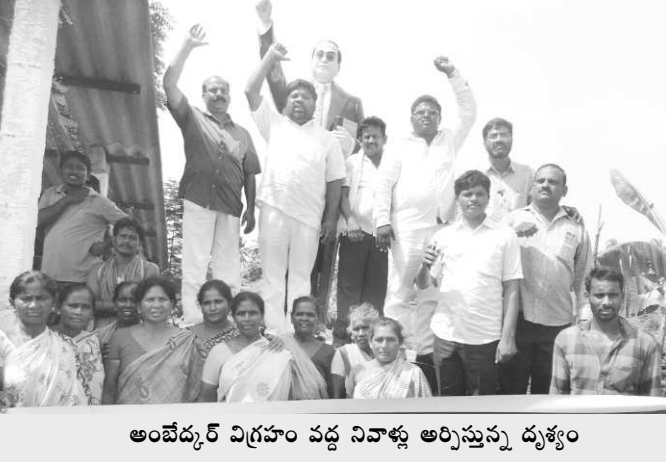
అంబేద్కర్ విగ్రహం వద్ద నివాళ్ళు అర్చిస్తున్న దృశ్యం