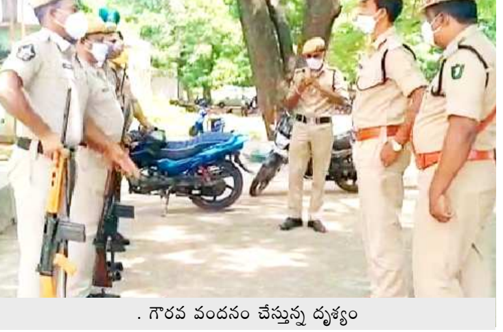
గౌరవ వందనం చేస్తున్న దృశ్యం