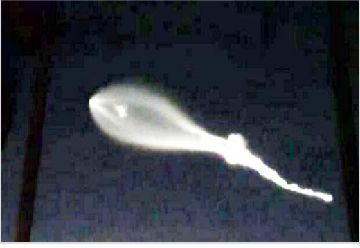
లాస్ ఏంజెల్స్ : సమయం బదులైన గంటలు కావాలి. అమెరికాలో అత్యంత ధనిక నగరం లాస్ ఏంజెల్స్ క్రైస్టిన్ షాపింగ్ హడావుడిలో ఉంది. ఇంతలో పసిఫిక్ మహా సముద్రం మీదుగా వచ్చిన ఓ వెలుగు

నగరజలను సంభ్రమశ్చార్మకాలకు గురి చేసింది. ఆకాశంలో చిన్న దీపంలా మొదలై భారీగా ఆకారంలోకి మారి విశ్వంలోకి దూసుకువెళ్తున్నది ఏంటో తెలిక అందరూ ఆయోమయంలో పడిపోయారు. పలువురు ఆ దృశ్యాన్ని తమ మొబైళ్లలో బంధించి ఏలియన్లు భూమి మీదకు వచ్చేశాయో? అంటూ సోషల్ మీడియాలో పోస్టులు చేయడం ప్రారంభించారు. అలా పోస్టులు చేసిన వారిలో స్పెన్స్ ఎక్స్ అధినేత ఎలాన్ మస్క్ కూడా ఉన్నారు. అది ఉత్తరకొరియాకు చెందిన న్యూక్లియర్ ఏలియన్ అంటూ మస్క్ ట్వీట్లలో పోస్టు చేశారు. స్పెన్స్ ఎక్స్ కంపెనీ తన ప్రముఖ రాకెట్ లాంచర్ ఫాల్కన్-9తో మరోసారి ప్రయోగం చేసింది. దాని వెలుగే ఆకాశంలో చిన్న దీపంలా మొదలై భారీ స్థాయికి చేరి నగరవాసులను ఆశ్చర్యానికి గురి చేసింది.