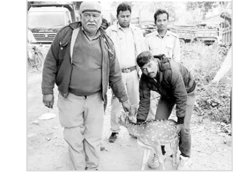
మహిళ ఆ లేడిని అటవీశాఖ అధికారులకు అప్పగించింది.

చితారా: జ్యూనియర్ ప్రతాపి పాటను స్టేషన్ పరిధిలోని నీమాకాల్లో ఒక మహిళ లేడి పిల్లను అటవీశాఖ అధికారులకు అప్పగించింది. 6 నెలల క్రితం గొర్రెలతోపాటు ఆ లేడిపిల్ల ఆమె ఇంటికి వచ్చేసింది. ఇన్నాళ్లు వాటితోపాటే తింటూ తిరిగింది. ఆ మహిళ కూడా లేడి పిల్లను ప్రేమగా సాకింది. అయితే ఈ లేడిపిల్లను ఎవరైనా చంపేస్తారేమోననే భయం ఆమెను నిత్యం వెంటాడింది. దీంతో ఆమె ఆ లేడిపిల్లను అటవీశాఖ అధికారులకు అప్పగించింది. వారు ఆ లేడిపిల్లను జూపార్కుకు తరలించారు. కాగా ఆ మహిళ లేడిపిల్లకు ఇంట్లో పాలు పట్టేది. తరువాత ఆ లేడిపిల్ల మిగిలిన గొర్రెపిల్లలతో కలిసి ఆడుకునేది. అయితే అది పెద్దది కాగానే దానిలో మార్పుల వచ్చాయి. దీంతో సదరు