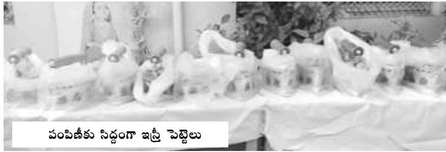
పంపిణీకు సిద్ధంగా ఇన్స్ట్రీ పెట్టెలు

చోడవరం : కుల వృత్తుల సంక్షేమాన్ని కోరి ప్రభుత్వం 'ఆదరణ' పథకం ప్రవేశపెట్టినట్లు స్థానిక ఎమ్మెల్యే కె.ఎన్.ఎన్.రాజు తెలియజేశారు. స్థానిక ఎం.పి.డి.బి. కార్యాలయంలో ఎం.పి.డి.బి జి.వి.చిట్టి రాజు అధ్యక్షతన శుక్రవారం జరిగిన కార్యక్రమంలో ఆదరణ పథకంలో విడుదలైన యంత్రాలు, పరికరాలను ఎమ్మెల్యే చేతుల మీదుగా అందజేశారు. ఈ సందర్భంగా ఎమ్మెల్యే రాజు మాట్లాడుతూ మారుతున్న కాల ప్రవాహంలో చేతి వృత్తులు కొన్ని అంతరించిపోతున్నాయన్నారు. ఆధునిక పోటీ ప్రపంచానికి దీటుగా నిలబడేందుకు ప్రభుత్వం సాంప్రదాయ వృత్తులను ప్రోత్సహించేందుకు "ఆదరణ" ప్రవేశపెట్టినట్లు తెలిపారు. ఈ పథకంలో 90 శాతం ప్రభుత్వ సబ్సిడీతో చేతి పనిముట్లను అందజేస్తున్నట్లు