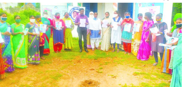
సమావేశం నిర్వహిస్తున్న దృశ్యం

గొలుగొండ : వైయస్సార్ ఆసరా సోషల్ ఆడిట్లో భాగంగా గొలుగొండ మండలంలో 1007 స్వయం సహాయక సంఘాలకు 28 కోట్ల 87 లక్షలు 11250 మెంబెర్లకు తయారు చేసిన సంఘాల వారిగా నిఇబ, ప్రాజెక్ట్ డైరెక్టర్, డిఆర్డిఎ వారి ఆదేశాలు ప్రకారం 20 సచివాలయంలో సమావేశమయ్యారు. ఈ నెల 25వ తేదీ నుంచి 28వ తేదీ వరకు 20 సచివాలయాలలో గ్రీవెన్స్ లు తీసుకోవడం జరుగుతుందన్నారు. ఈ కార్యక్రమం సచివాలయం వెల్చేర్ అసిస్టెంట్స్, వెలుగు విజయల పాల్గొన్నారు.