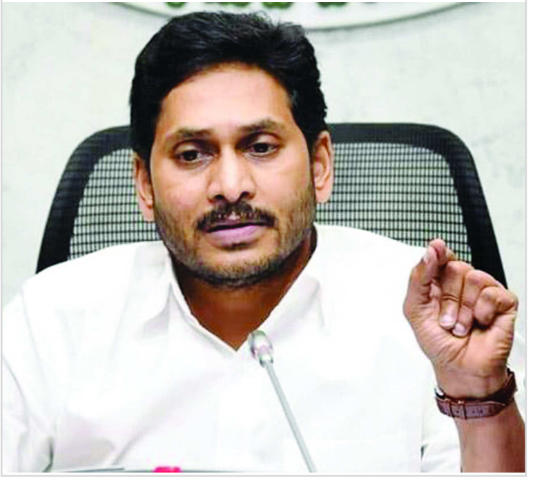
సహాయం అందించామని.. బ్యాంకులకు ఈ డబ్బుపై ఎలాంటి హక్కు లేదని సీఎం జగన్ స్పష్టం చేశారు. ఎక్కడైనా సమస్యలు వస్తే కలెక్టర్లు వెంటనే పరిష్కరించాలని ఆదేశించారు. మహిళలకు స్థిరమైన జీవనోపాధి మార్గాలను చూపడానికి.. హిందూస్థాన్, యూనిలివర్, ఐటీసీ, పీఓజి, రిలయన్స్, అమూల్.. అలానా గ్రూపులతో అవగాహన ఒప్పందాలు కుదుర్చుకున్నామన్న ముఖ్యమంత్రి.. రాష్ట్ర స్ట్రాటెజీ ప్రతి 15 రోజులకోసారి మంత్రుల బృందం రివ్యూ చేస్తుందని తెలిపారు. మహిళలు ఎంపిక చేసుకున్న జీవనోపాధి మార్గాల్లో చేయూతనివ్వాలని.. వారికి ఏం కావాలో దగ్గరుండి చూసుకోవాలని అధికారులను

తాడేపల్లి: ఇళ్ల పట్టాల పంపిణీ కార్యక్రమాన్ని త్వరలోనే చేపడతామని ఆంధ్రప్రదేశ్ ముఖ్యమంత్రి వైఎస్ జగన్మోహన్ రెడ్డి పునరుద్ఘాటించారు. రూ.22వేల కోట్ల విలువైన ఆస్తులను.. 30లక్షల మంది ఆక్వాచెల్లెమ్మల పేరిట రిజిస్ట్రేషన్ చేయబోతున్నామని హర్షం వ్యక్తం చేశారు. ఇళ్ల పట్టాల పంపిణీ సహా వివిధ అంశాలపై సీఎం వైఎస్ జగన్ మంగళవారం తన కార్యాలయంలో సమీక్ష నిర్వహించారు. ఈ సందర్భంగా ఆయన మాట్లాడుతూ.. ప్లాట్ల అభివృద్ధి, మార్కింగ్, ఇళ్ల పట్టాల రిజిస్ట్రేషన్ ప్రక్రియ త్వరంగా పూర్తి చేయాలని ఆదేశించారు. కాగా టీడీపీ నాయకుల తీరు కారణంగా ఇళ్ల పట్టాల పంపిణీ కార్యక్రమం ఇప్పటికే పలుమార్లు వాయిదా పడిన విషయం తెలిసింది. ఈ విషయం గురించి సీఎం జగన్ మాట్లాడుతూ.. "దేశంలో ఎక్కడా ఇలాంటి కార్యక్రమం జరగలేదు. మంచి కార్యక్రమానికి శత్రువులు ఎక్కువగా ఉన్నారు. చంద్రబాబు, టీడీపీ నేతలు కేసులు వేసి అడ్డుకుంటున్నారు. ఆ సమస్యలను అధిగమించేందుకు వివిధ వేదికలపై పోరాటం చేయాల్సి వస్తోంది. కొంత సమయం పట్టినా చివరకు న్యాయమే గెలుస్తుంది" అని పేర్కొన్నారు.