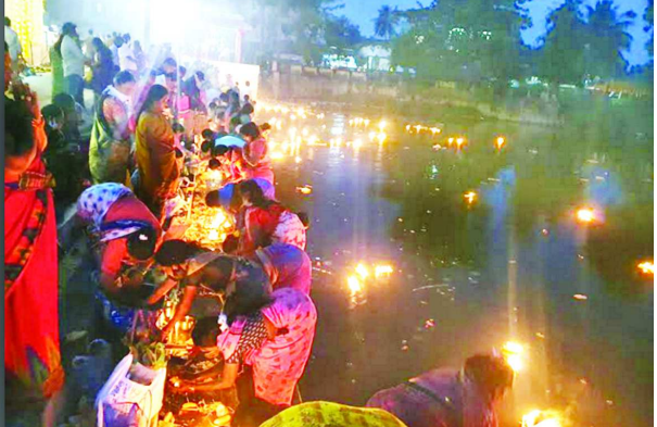
స్వయంభు గౌరీశ్వర స్వామి వుష్కరిణి వద్ద పోలి పాద్యమి కోలాహలం