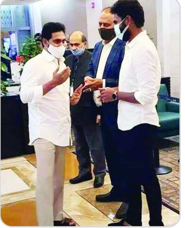
డిల్లీ చేరుకున్న ఆంధ్రప్రదేశ్ రాష్ట్ర ముఖ్యమంత్రి వైయస్ జగన్మోహన్ రెడ్డి కి స్వాగతం పలికిన వై.యస్.ఆర్.సీపీ ఎంపీలు.