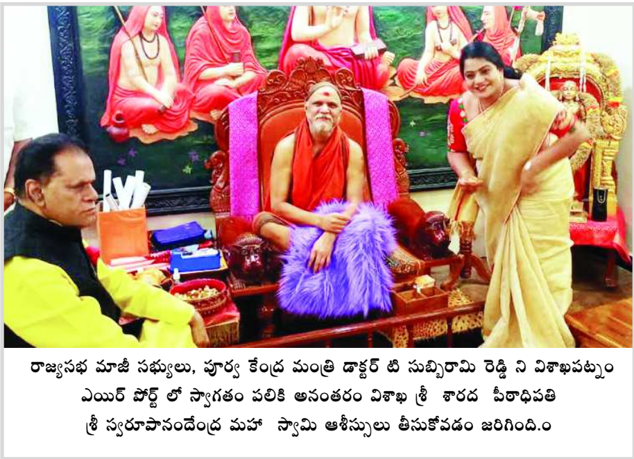
రాజ్యసభ మాజీ సభ్యులు, పూర్వ కేంద్ర మంత్రి డాక్టర్ బి సుబ్బిరామి రెడ్డి ని విశాఖపట్నం ఎయిర్ పోర్ట్ లో స్వాగతం పలికి అనంతరం విశాఖ శ్రీ శారద పీఠాధిపతి శ్రీ స్వరూపానందేంద్ర మహా స్వామి ఆశీస్సులు తీసుకోవడం జరిగింది.