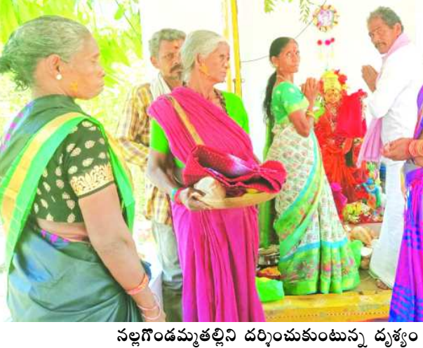
నల్లగొండమ్మ తల్లిని దర్శించుకుంటున్న దృశ్యం