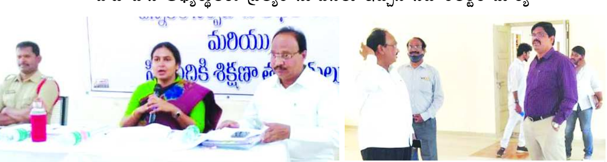
పోటీ చేసే అభ్యర్థులకు సూచనలు ఇస్తున్న సబ్ కలెక్టర్ మార్కె

- ఉపసంహరణ ప్రక్రియ ను పరిశీలన చేసిన జాయింట్ కలెక్టర్ ఆర్ గోవిందరావు. - పోటీ చేసే అభ్యర్థులకు ప్రత్యేక సూచనలు ఇచ్చిన సబ్ కలెక్టర్ మార్కె