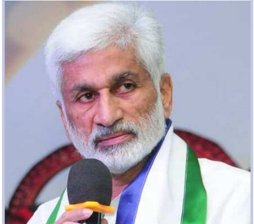
తీసుకురానుందని తెలిపారు. జగన్మోహన్ రెడ్డి ప్రభుత్వం తీసుకున్న ఈ నిర్ణయంతో పాఠ్యపుస్తకాలు కొరతకు చెక్ పడనుందని అన్నారు.

అమరావతి (విజయభాను న్యూస్): రాష్ట్రంలో విద్యార్థులకు పాఠ్యపుస్తకాల కొరత లేకుండా చూసేందుకు పీడిఎఫ్ రూపంలో ఆన్లైన్ అందుబాటులో ఉండేలా ఆంధ్రప్రదేశ్ ప్రభుత్వం చర్యలు చేపట్టిందని రాజ్యసభ సభ్యులు, వైఎస్ఆర్ సిపి జాతీయ ప్రధాన కార్యదర్శి విజయసాయిరెడ్డి అన్నారు. ఈ మేరకు ఆయన సోషల్ మీడియా వేదికగా పలు అంశాలపై గురువారం స్పందించారు. ఒకటి నుంచి 10 వ తరగతి వరకు అన్ని సబ్జెక్టుల కలిసి మొత్తం 371 రకాల పుస్తకాలను ఆన్ లైన్ లో ఉచితంగా ప్రభుత్వం అందుబాటులో