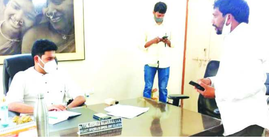
పాడేరు : ముంచంగిపుట్టు మండలం దారెల పంచాయితీ పరిధిలో గల తలింబ, పెదాపేట గ్రామాలలో పాటు మండలం లో అనేక గ్రామాలలో జి. సి. సి నుండి గ్రామాలకి రేషన్ వెళ్ళలేదని మ్యాపింగి జరుగుతుందన్న కారణం పేరుతో 10 శాతం జరగలేదని ఐటిడిపి పిఠి కి