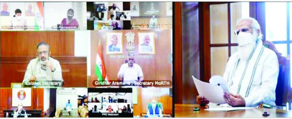
3,300 మెట్రిక్ టన్నుల మేర పెరిగినట్లు పీఎంవో ప్రకటనలో పేర్కొంది. 20 రాష్ట్రాలకు డిమాండ్ కు మించి సరఫరా చేసినట్లు తెలిపింది. సుదీర్ఘ దూరం పంపే ట్యాంకర్ల కోసం నైల్స్ ను ఉపయోగిస్తున్నట్లు పేర్కొంది.

దిల్లీ: దేశవ్యాప్తంగా పలు రాష్ట్రాల్లో ఆక్సిజన్ కొరత ఏర్పడిన వేళ ప్రధానమంత్రి నరేంద్రమోదీ నేడు ఉన్నత స్థాయి సమీక్ష నిర్వహించారు. ఆక్సిజన్ సరఫరా, ఉత్పత్తి తదితర అంశాలపై కేంద్ర, రాష్ట్ర ఉన్నతాధికారులతో చర్చించారు. ఆక్సిజన్ అక్రమ నిల్వలపై రాష్ట్రాలు చర్యలు తీసుకోవాలని మోదీ ఈ సందర్భంగా సూచించారు. వివిధ రాష్ట్రాలకు ఆక్సిజన్ సరఫరా సజావుగా సాగేలా చూడాలని అధికారులను ఆదేశించారు. చాలా రాష్ట్రాల నుంచి ప్రాణవాయువుకు డిమాండ్ పెరుగుతున్న నేపథ్యంలో ఆక్సిజన్ ఉత్పత్తి పెంచే ప్రక్రియను మరింత వేగవంతం చేయాలని మోదీ కోరినట్లు ప్రధానమంత్రి కార్యాలయం ఓ ప్రకటనలో తెలిపింది.