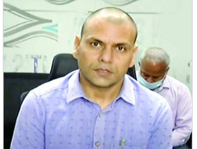
నిండినట్లు చెప్పారు. మాస్కు ధరించకపోతే రూ.1000 జరిమానా వేస్తున్నట్లు తెలిపారు.

గుంటూరు: ఆంధ్రప్రదేశ్లో కోవిడ్ తీవ్రంగా ఉందని రాష్ట్ర వైద్యారోగ్య శాఖ ముఖ్య కార్యదర్శి అనిల్కుమార్ సింఘాల్ అన్నారు. గుంటూరులో ఆయన మీడియాతో మాట్లాడారు. కేసులు తగ్గినప్పుడు కరోనా కేర్ సెంటర్లను మూసివేశామని.. ఇప్పుడు మళ్ళీ వాటిని ఏర్పాటు చేస్తున్నట్లు చెప్పారు. ఇందులో భాగంగా 21వేల మంది వైద్య సిబ్బందిని విధుల్లోకి తీసుకోవాలని.. ఆస్పత్రులు, ఔషధాలు, పడకలు సిద్ధం చేయాలని ఆదేశించినట్లు తెలిపారు. ప్రస్తుతం ప్రభుత్వ ఆస్పత్రుల్లో 36 వేలు, ప్రైవేటు ఆస్పత్రుల్లో 8 వేలు రెమెడెసివర్ ఇంజెక్షన్లు అందుబాటులో ఉన్నాయన్నారు. మరో నాలుగు లక్షల ఇంజెక్షన్లు సరఫరా చేయాలని కేంద్ర ప్రభుత్వాన్ని కోరనట్లు పేర్కొన్నారు. ప్రస్తుతం రాష్ట్రంలో 320 మెట్రిక్ టన్నుల ఆక్సిజన్ అందుబాటులో ఉందని.. చెన్నై, బళ్లారి నుంచి మరో 200 మెట్రిక్ టన్నుల ఆక్సిజన్ వస్తుందని వెల్లడించారు. రాష్ట్రంలో ఆక్సిజన్, రెమెడెసివర్ అవసరం అంతగా లేదన్నారు. కోవిడ్ వ్యాప్తి నేపథ్యంలో 19వేల పడకలు సిద్ధం చేస్తే 11 వేల పడకలు