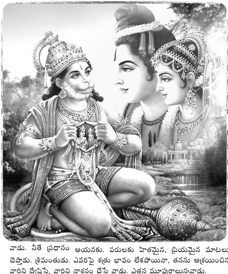
వాడు. సీతే ప్రధానం ఆయనకు. పరులకు హితమైన, ద్రుయమైన మాటలు చెప్పాడు. శ్రీమంతుడు. ఎవరో తెలు భావం లేకపోయినా, తనను ఆశ్రయించిన వారిని ద్వేషిస్తే, వారిని నాశనం చేసే వాడు. ఎత్తైన మూపురాలున్నవాడు.

సచ్చరిత్రుడుగా తెలుపుతుంది. విధిషణ శరణాగతి ద్వారా రాముడి ఆత్మవంతుడి లక్షణాన్ని బయటపెడుతుంది. ఇంద్రజిత్తుపై కోపించక పోవడం, చేజిక్కిన రావణుడిని విడిచిపెట్టడం, రాముడి జిత్రోదత్తాన్ని తెలుపుతుంది. విరోధిన రావణుడిని మెచ్చు కోవడమంటే రాముడికి అనూయలేదనే కదా. ఇలానే రాముడు కాంతియుక్తుడని-భయం కరుదని పలు సందర్భాల్లో అర్థమవుతుంది. వాల్మీకి శ్లాఘించిన గుణాలు అసమానమైనవి. ఒక్క గుణంలో అంతర్లీనంగా ఇంకొన్ని వుండడంతో అవి అనేకమయ్యాయి. మనుష్యమాత్రులందు ఇవి కనపడవు. ఇట్టి సుగుణ సంపత్తికలవాడు, ఇక్ష్వాకుల మహారాజు వంశంలో, రామా రామా రామా, అని లోకాలు పాగిడే రామచంద్రప్రూర్ణ అనే పేరుగలాయన మాత్రమే. అతివీర్యవంతుడాయన. అసమాన మైన-వివిధమైన-విచిత్రమైన శక్తిగలవాడు. సర్వం తెలిసిన