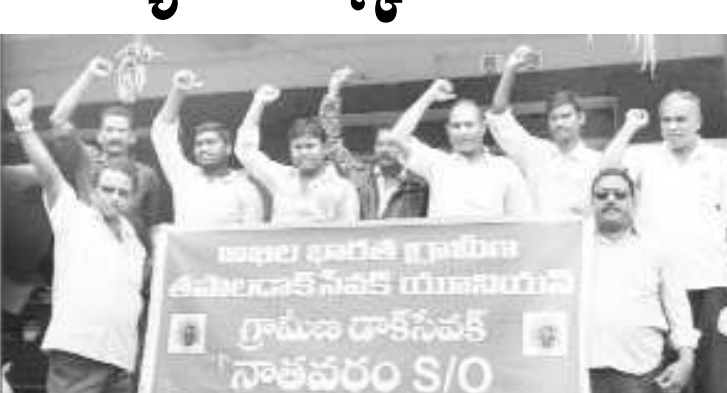
ఆందోళన చేస్తున్న డాక్ సేవకులు