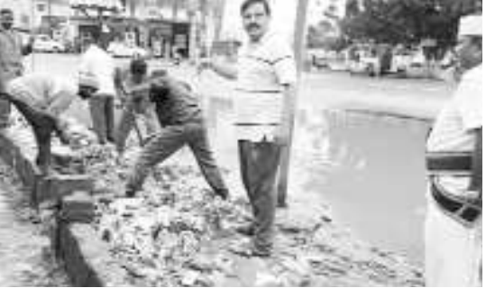
చేయాలని సూచించారు. పారిశుధ్యంపై స్థానిక ప్రజలు అవగాహన పెంచుకుని సహకరించాలని కోరారు. తుఫాన్ సందర్భంగా వర్షంలో కూడా విడుదల నిర్వహించిన పారిశుధ్య సిబ్బందిని ఈ సందర్భంగా అభినందించారు.