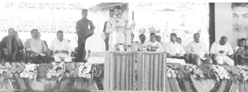
బహిరంగ సమావేశంలో మాట్లాడుతున్న సి.ఎం.

చోడవరం : మాయమాటలు నమ్మొద్దని, ప్రజల్ని అన్ని విధాలా ఆదుకునేది తెలుగుదేశం పార్టీయే అని రాష్ట్ర ముఖ్యమంత్రి నారా చంద్రబాబునాయుడు తెలియజేశారు. రూ.2,200 కోట్లతో తలపెట్టిన పోలవరం లెఫ్ట్ కెనాల్, బాబూ జగజ్జీవనరామ్ ఉత్తరాంధ్ర సుజల స్రవంతి ఫేస్ 1 పథకానికి గురువారం చోడవరంలో సి.ఎం. చంద్రబాబు శంఖుస్థాపన చేసారు. అనంతరం చోడవరం ఎమ్మెల్యే కె.ఎస్.ఎస్.ఎస్.రాజు అధ్యక్షతన ఏర్పాటు చేసిన బహిరంగ సమావేశంలో సి.ఎం. మాట్లాడుతూ రానున్న ఖరీఫ్ సీజన్ పాటికి పోలవరం ఎడమ కాల్వ ద్వారా ఉత్తరాంధ్రలో వరు నియోజకవర్గాల్లో 65,000