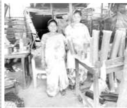
అరకులోయ : అరకులోయ ప్రాంతం అంటే లేదని బొంగు చికెన్ వ్యాపారస్తులు ఆవేదన పర్యాయక ప్రాంతం అధిక సంకల్ప వర్యా పడుతున్నారు.

టకులు దర్శించే ప్రాంతం ఇలాంటి ప్రాంతంలో వ్యాపారం బాగుంటుంది అను కున్నాము కానీ, వ్యాపారం లేక అమ్ముడు పోక చాలా ఖాళీ గా ఉందని బొంగు చికెన్ వ్యాపార దారులు అంటున్నారు. రోజు ఎంతో కొంత వచ్చే దబ్బులతో కుటుంబం పోషణ జరుగుతుంది అంటున్నారు. వ్యాపారం లేక కొన్ని సంధర్భంలో పన్నులు ఉన్న రోజులు ఉన్నాయి అని అంటున్నారు. ఈ ఏడాది పర్యాటకులు పెద్దగా లేక వ్యాపారం సాగటం