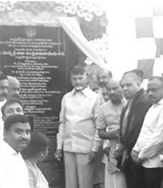
సుజల స్రవంతి పథకానికి శంఖుస్థాపన చేస్తున్న సి.ఎం., మంత్రులు

- ఉత్తరాంధ్ర సుజల స్రవంతి ఫేస్ 1 శంఖుస్థాపన చేసిన సి.ఎం. చంద్రబాబునాయుడు - చోడవరానికి 2,500 జి+3 ఇళ్లు మంజూరు