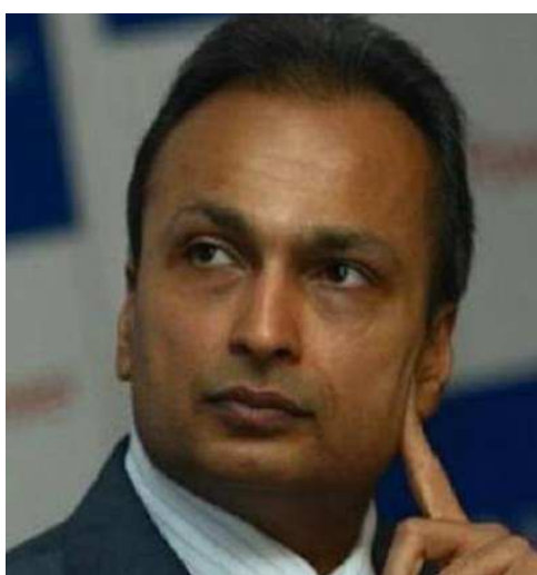
ఇతర ఆర్కామ్ గ్రూప్ సంస్థలపని బ్యాంకులు తెలిపాయి.