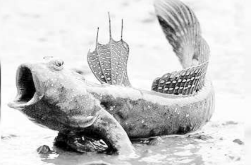
న్యూఢిల్లీ : నీటి నుంచి బయటపడిన చేప ప్రాణాలతో ఉంటుందని కలలో కూడా ఊహించలేం. అయితే ఈ

చేపలు.. నీటి బయట ప్రాణంతో ఉండటంతోపాటు, భూమిపై ముందుకు కదలడం విశేషం. ఈ చేపలు థాయిలాండ్ లో కనిపిస్తాయి. పినిపిక్ ఆసియా సముద్రంలో మడ సెప్పర్ అనే చేపలుంటాయి. ఇవి నీటి బయట కూడా మనగలుగుతాయి. వీటి శరీరంపై రెండు స్పాంజ్ పొడులూంటి నిర్వాహాలుంటాయి. దీంతో ఇవి బయటకు వచ్చినప్పుడు వీటిలో నీటిని నింపుకొని వస్తాయి. అప్పుడు ఆ నీటి వీటికి ఆధారంగా నిలుస్తుంది. ఈ రెండు సంచలనం నీరు అయిపోగానే ఈ చేప తిరిగి నీటిలోనికి వెళ్లిపోతుంది. ఈ చేప కళ్లు దాని తల పైభాగాన ఉండటం విశేషం.