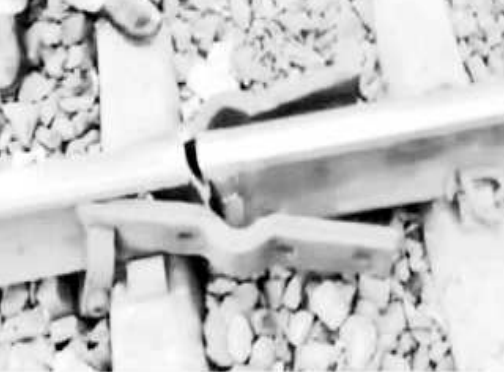
కోల్ కతా : హౌరా-న్యూఢిల్లీ మార్గంలో భారీ రైలు ప్రమాదం తప్పింది. ఓ వ్యక్తి చూపిన విచేతం వల్ల వందలాది అమానుకుల ప్రాణాలు నిలిచాయి. బుద్ధాన్ జిల్లాలో ఆదివారం జరిగిన ఈ సంఘటన వివరాలను ఓ

వార్తా సంస్థ తెలిపింది. అయితే దీనిపై పశ్చిమ రైల్వే అధికారులు ఎటువంటి ప్రకటన చేయలేదు. ఆ వార్తా సంస్థ కథనం ప్రకారం హౌరా-న్యూఢిల్లీ మార్గంలో బుద్ధాన్ జిల్లాలో రైలు పట్టాలను దగ్గరకు చేర్చి, పట్టి ఉంచే ఫిట్ స్టేట్ తోలగిపోయి ఉండటాన్ని స్థానికుడొకరు గమనించారు. అదే సమయంలో అటువైపు ఓ రైలు దూసుకొస్తుండటాన్ని చూశారు. వెంటనే అప్రమత్తమై తన వద్దనున్న ఎర్రని వస్త్రాన్ని ఊపుతూ, రైలు డ్రైవర్ కు సంకేతాలు పంపించారు. రైలు డ్రైవర్ కూడా ఏదో ప్రమాదం పొంది ఉందని గ్రహించి, అత్యవసరంగా బ్రేకులు వేసి, రైలును ఆపేశారు. దీంతో ఆ రైలు ఫిట్ స్టేట్ తోలగిపోబడి ఉన్న ప్రదేశానికి కాస్త దూరంలో ఆగింది. దీంతో ప్రయాణికులంతా ఊపిరి పీల్చుకున్నారు. రైలు డ్రైవర్ ను, స్థానికుడిని ప్రశంసించారు.