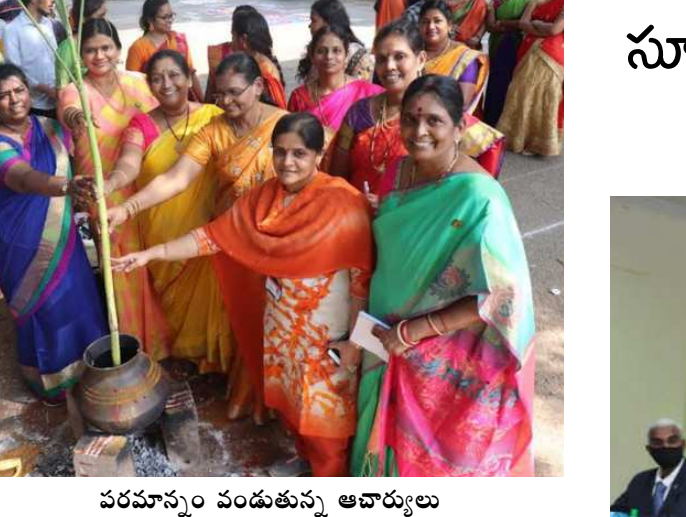
చరమాన్నం వండుతున్న ఆచార్యులు