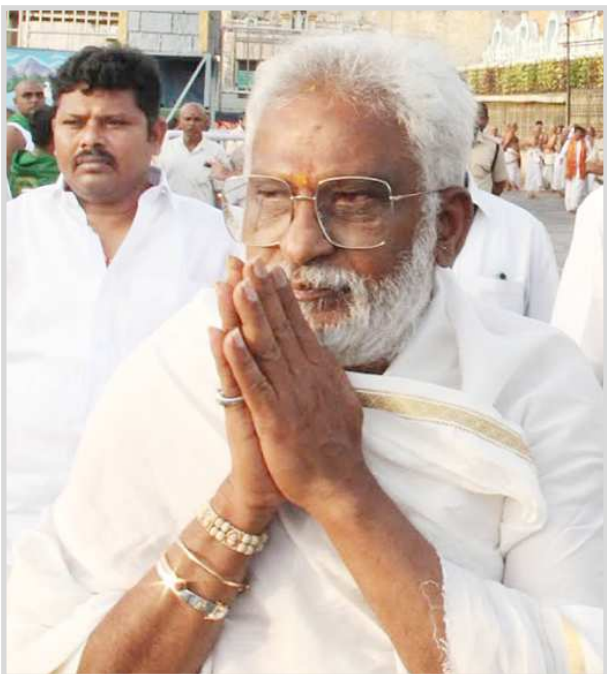
కలెక్టర్, ఆర్డీవో, తహసీల్దార్ కార్యాలయాల ద్వారా నమోదు చేసుకోవచ్చు న్నారు. ఇతర రాష్ట్ర ప్రభుత్వాలు ముందుకు వస్తే టీటీడీ ఆధ్వర్యంలో సామూహిక ఉచిత వివాహాలు జరిపిస్తామని చెప్పారు.

తిరుమల (విజయభాను న్యూస్): రాష్ట్ర వ్యాప్తంగా అన్ని జిల్లా కేంద్రాల్లో ఆగస్టు 7వ తేదీ ఉచిత సామూహిక వివాహాలు పెద్ద ఎత్తున నిర్వహిస్తామని టీటీడీ చైర్మన్ వైవి సుబ్బారెడ్డి తెలియజేశారు. శ్రీవారి ఆలయం ఎదుట శుక్రవారం ఆయన మీడియాతో మాట్లాడారు. దివంగత వైఎస్ రాజేశేఖర్ రెడ్డి ముఖ్యమంత్రిగా ఉండగా, టీటీడీ ఆధ్వర్యంలో కళ్యాణ మన్ను ఉచిత సామూహిక వివాహాలు పెద్ద ఎత్తున నిర్వహించారని చెప్పారు. ఆయన మరణం తరువాత ఈ కార్యక్రమం నిలిపి వేశారనీ, ముఖ్యమంత్రి వైఎస్ జగన్మోహన్ రెడ్డి ఆదేశంతో ఈ కార్యక్రమం పునఃప్రారంభించాలని తమ పాలకమండలి నిర్ణయం తీసుకుందని సుబ్బారెడ్డి వివరించారు. పేదలకు తమ పిల్లల వివాహాలు ఆర్థికంగా భారమై వారు ఇబ్బందులు పడకూడదనే ఉద్దేశంతో శ్రీ వేంకటేశ్వర స్వామి ఆశీస్సులతో ఉచితంగా వివాహాలు జరిపించనున్నామని చెప్పారు. ఆగస్టు 7వ తేదీ చాంద్రమాన శుభకృత్ నామ సంవత్సరం శ్రావణ శుక్ల దశమి ఆదివారం ఉదయం 8.07 గంటల నుంచి 8.17 గంటల మధ్య అనూరాధ నక్షత్రం సింహ లగ్నంలో వివాహాలు జరిపించాలని పండితులు సుముహూర్తం నిర్ణయించారని చైర్మన్ తెలిపారు. అర్హులైన వారందరూ ఆయా జిల్లా