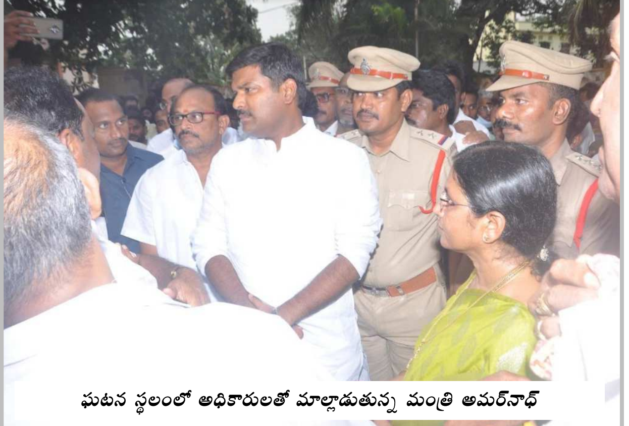
ఘటన స్థలంలో అధికారులతో మాట్లాడుతున్న మంత్రి అమర్నాథ్