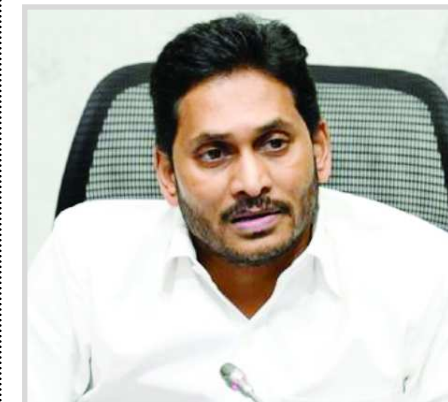
విజయవాడ: వైజాగ్ స్ట్రీటుఫ్లాంట్ అంశంపై ముఖ్యమంత్రి వైఎస్ జగన్మోహన్రెడ్డి ప్రధాని నరేంద్ర మోదీకి మరోసారి లేఖ రాశారు. స్ట్రీటుఫ్లాంట్ను ప్రైవేటీకరించవద్దని, కేంద్రం

నిర్ణయం మార్చుకోవాలని విజ్ఞప్తి చేశారు. ఈ సందర్భంగా ప్రధాని మోదీ ఆపాయింట్మెంట్ కోరిన సీఎం జగన్, తనతో పాటు అఖిలపక్షాన్ని కూడా తీసుకువస్తానని పేర్కొన్నారు. "కేంద్ర ప్రకటన తీవ్ర ఆందోళనకు గురిచేస్తోంది. విశాఖ స్ట్రీటుఫ్లాంట్ అంశంపై మనోభావాలతో ముడిపడిన అంశం. స్ట్రీటుఫ్లాంట్ ప్రత్యేకంగా 20వేల కుటుంబాలు ఆధారపడ్డాయి. అఖిల పక్షం, కార్మిక సంఘాల ప్రతినిధులను వెంట తీసుకొస్తాం. ఏపీ ప్రజలు, కార్మికుల అభిప్రాయాలను మీ ముందు ఉంచుతాం. ఫ్లాంట్ పునరుద్ధరణకై మన ముందున్న అప్పజ్ఞను నేరూగా వివరిస్తాం" అని సీఎం వైఎస్ జగన్ తన లేఖలో పేర్కొన్నారు. ఫ్లాంట్పై దృష్టిపెడితే కచ్చితంగా లాభాల్లోకి వచ్చే అవకాశం ఉందని తల్చిపున్నట్లు వివరించారు.