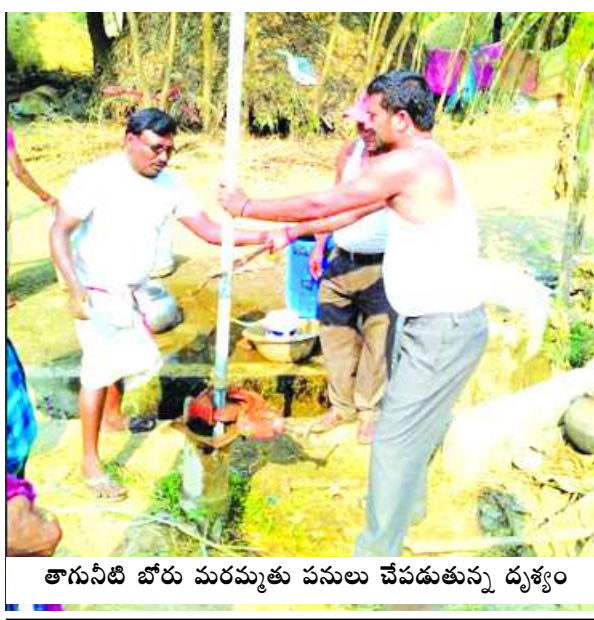
తాగునీటి బోరు మరమ్మత్తు పనులు చేపడుతున్న దృశ్యం