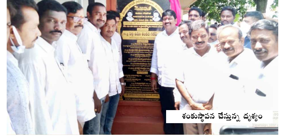
గొలుగొండ : గ్రామాల్లో సమస్యలు పరిష్కరించేందుకే జగనన్న పల్లెబాట కార్యక్రమం చేపడుతున్నామని నర్సీపట్నం ఎమ్మెల్యే ఉమాశంకర్ గణేష్ అన్నారు. గొలు గొండ మండలం గాదంపాలెం, గింజర్తి, లింగంపేట గ్రామాల్లో గురువారం జగనన్న పల్లెబాట నిర్వహించారు. ఈ సందర్భంగా ఏర్పాటు చేసిన సమావేశంలో ఆయన మాట్లాడుతూ గ్రామ స్థాయిలో సమస్యలకు తక్షణ పరిష్కారం చేపట్టాలని ఉద్దేశంతోనే ముఖ్యమంత్రి అదేశాల మేరకు జగనన్న పల్లెబాట కార్యక్రమం చేపడుతున్నా మన్నామన్నారు. అధికారులు ప్రజల సమస్యలు వేంటే పరిష్కరించేందుకు కృషి చేయాలన్నారు. అంతకు ముందు కొత్తగా నిర్మాణం పూర్తి చేసుకున్న గాదంపాలెం నుంచి తాండవ నదికి వెళ్లి గంగాదేవి గుడి వరకు రోడ్డు నిర్మాణం పనులు పరిశీలించి తారు రోడ్డును ప్రారంభించారు. అనంతరం లింగంపాలెంపై