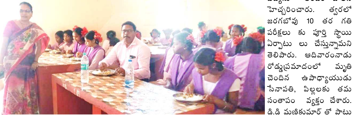
విద్యార్థులతో కలిసి భోజనం చేస్తున్న డిడి

నిర్వహించి శాఖాపరమైన చర్యలు తీసుకుంటామని డిడి తెలిపారు. ఇటీవల గుమ్మకొట గురుకులం లో అన్యాయం జరుగుతుందని, యస్.టి, కమిషన్ ప్రభుత్వం దృష్టికి తీసుకువెళ్లడం తో జిల్లా కలెక్టర్ ఆదేశాలు మేరకు దర్యాప్తు నిర్వహించి ప్రస్తుతం పైశాఖాపరమైన చర్యలు తీసుకున్నామని తెలిపారు. అందువలన ఆశ్రమ పాఠశాలల్లో విద్యలు నిర్వహిస్తున్న హెచ్.ఎం లు, వార్డెన్ లు, సక్రమంగా విద్యలు నిర్వహించి నాణ్యమైన విద్యను అందించాలని హెచ్చరించారు. త్వరలో జరగబోవు 10 తరగతి పరీక్షలు కు పూర్తి స్థాయి ఏర్పాటు లు చేస్తున్నామని తెలిపారు. ఆదివారంనాడు రోడ్డుప్రమాదంలో మృతి చెందిన ఉపాధ్యాయుడు సేనావతి, పిల్లలకు తమ సంతాపం వ్యక్తం చేశారు. డి.డి మణికుమార్ తో పాటు ఎ.టి.డబ్ల్యూ పాల్గొన్నారు.