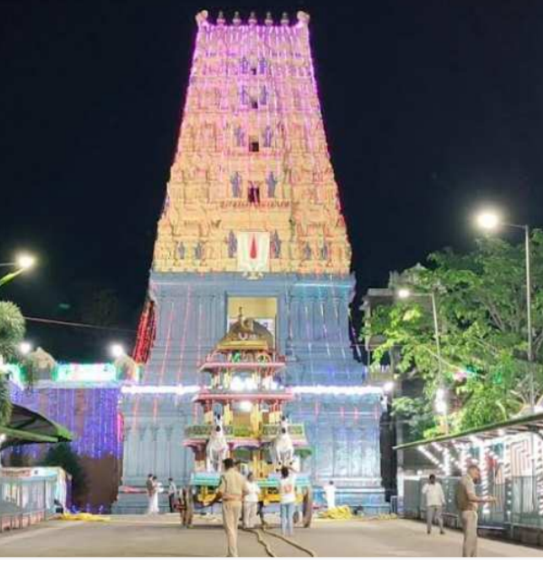
శ్రీ స్వామివారి వార్షిక కళ్యాణానికి సర్వం సిద్ధం విద్యుత్ అలంకరణతో దేదీప్యమానంగా వెలుగొందుతున్న అప్పన్న దేవాలయం