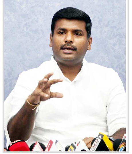
అని చెప్పుకుంటున్న చంద్రబాబు ఏ విధంగా శిలాఫలకం వేశారని ఆయన ప్రశ్నించారు. శిలాఫలకం, తాపీ మేడ్చి ఉంటే పోర్టు నిర్మాణం జరిగిపోతుందా? అని అమర్నాథ్ ఎద్దేవా చేశారు. భోగాపురం ఎయిర్పోర్ట్ రన్వేకి సంబంధించిన స్థల

విశాఖపట్నం(విజయభాను న్యూస్) : చంద్రబాబు నాయుడు 14 ఏళ్ల తన పాలనలో ఉత్తరాంధ్రను ఉత్తిఆంధ్రగా మార్చాడు.. జగన్మోహన్ రెడ్డి ఉత్తరాంధ్రను ఉత్తమ ఆంధ్రగా తీర్చి దిద్దనన్నారని రాష్ట్ర పరిశ్రమల శాఖ మంత్రి గుడివాడ అమర్నాథ్ అన్నారు. స్థానిక సర్కూల్ హౌస్ లో మంగళవారం ఏర్పాటు చేసిన విలేకరుల సమావేశంలో ఆయన మాట్లాడుతూ రామాయపట్నం పోర్టుకి, భోగాపురం ఎయిర్ పోర్ట్ కి తానే శంకుస్థాపన చేశానని డబ్బాలు కొట్టుకుంటున్న చంద్రబాబు ఇకవైనా అసత్యాలు మానుకోవాలని మంత్రి హితవు పలికారు. 2019లో ఎన్నికల నోటిఫికేషన్ కు కేవలం నెల రోజులు ముందు శంకుస్థాపన చేసి భాబు చేతులు దులుపుకున్నాడు. భోగాపురం ఎయిర్పోర్ట్ లోని రన్వేకి సంబంధించిన 40 ఎకరాల భూమి కోర్టు వివాదాల్లో ఉండగా ఆయన ఏ విధంగా శంకుస్థాపన చేశాడని అమర్నాథ్ ప్రశ్నించారు. అలాగే రామాయపట్నం పోర్టుకి ఎటువంటి క్లియరెన్సు రాకపోయినా, 40 ఇయర్స్ ఇండస్ట్రీ