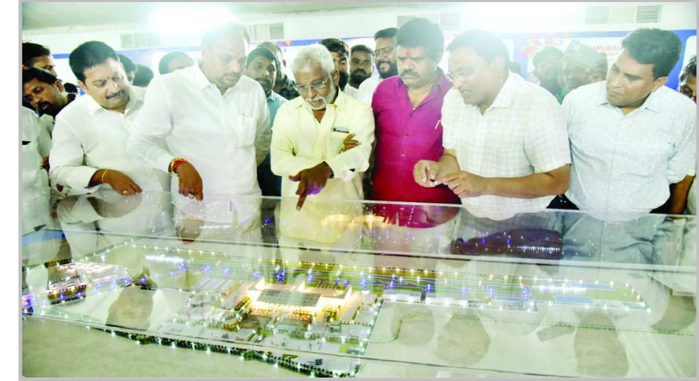
బోగాపురం ఎయిర్పోర్ట్ ప్రారంభ సందర్భంగా సీఎం జగన్ పర్యటన ఏర్పాట్లను పరిశీలించిన ఉత్తరాంధ్ర సమన్వయకర్త వైవి సుబ్బారెడ్డి, అధికారులు, ప్రజా ప్రతినిధులు

నేడు బోగాపురం ఎయిర్పోర్టు పనులకు శ్రీకారం మధురవాడలో వైజాగ్ టెక్ పార్క్ (అదానీ డేటా సెంటర్) శంకుస్థాపన