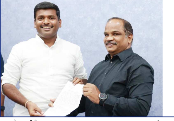
పరిశీలనలోనే సభ్యత్వము మరియు ఎన్నికలను నిర్వహిస్తామని స్పష్టమైన హామీ ఇచ్చారు... మరియు వివరాలు వినతి పత్రంలో తెలియజేయడమైనది..

విశాఖపట్నం (విజయభాను న్యూస్): జాతీయ, రాష్ట్ర స్థాయికి ఇలా అనేక జర్నలిస్టు సంఘాలు వాటి నేతలు, ప్రింటి మీడియా ఎలక్ట్రానిక్ మీడియా ఇలా అనేకమంది వాసుదైక కుటుంబాలా కొనసాగుతున్న వీజేఎఫ్ లో ఏదో కారణాలతో 12 సంవత్సరాలుగా సర్వసభ్య సమావేశాలు నిర్వహించకుండా, ఏడాదికి ఆ ఏడాది ఆదాయ వ్యయాల సభ్యులకు తెలియజేయకుండా నేటికీ కొనసాగుతున్న అర్హత లేని కమిటీ వెంటనే రద్దు చేయాలని. ప్రభుత్వ అధికారుల పరిశీలనతో ప్రత్యేక కమిటీ ఏర్పాటు చేసి వీ జే ఎఫ్ సభ్యత్వం నమోదు, ఎన్నికల ప్రక్రియను పారదర్శకంగా జరిపించాలని రాష్ట్ర పరిశ్రమల శాఖ మంత్రి గుడివాడ అమర్ కలిసి సీనియర్ పాత్రికేయులు డాక్టర్ ఎం.ఆర్.ఎన్ వర్మ సాయంత్రం ప్రభుత్వ అతిథి గృహంలో కలిసి వినతి పత్రం సమర్పించారు. వి జె ఎఫ్ సభ్యుల ఫిర్యాదుతో ఇప్పటికే ముగ్గురు ఉన్నత ప్రభుత్వ అధికారులతో విచారణ పూర్తయి నివేదిక సైతం కలెక్టర్ కి సమర్పించడం జరిగిందని తెలియజేశారు. మంత్రి అమర్ స్పందిస్తూ స్పందిస్తూ తప్పకుండా ప్రభుత్వ అధికారుల