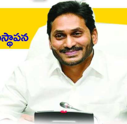
నేడు విశాఖలో సీఎం వైఎస్ జగన్ పర్యటన..

విశాఖపట్నం (విజయభాను న్యూస్) : నేడు విశాఖలో ముఖ్యమంత్రి వైఎస్ జగన్మోహన్ రెడ్డి పర్యటించనున్నారు. విశాఖలో అదానీ డేటా సెంటర్ టెక్నాలజీ, బిజినెస్ పార్కులకు సీఎం జగన్, గౌతమ్ అదానీ శంకుస్థాపన చేయనున్నారు. మధురవాడలో ఇంటిగ్రేటెడ్ డేటా సెంటర్, టెక్నాలజీ పార్క్ - రూ.14,634 కోట్ల పెట్టుబడితో అదానీ సంస్థ ఏర్పాటు చేయనుంది. 130 ఎకరాల్లో 200 మెగావాట్ల డేటా సెంటర్, ఇంటిగ్రేటెడ్ పార్క్, స్మిల్ యూనివర్సిటీ ఏర్పాటు కానుంది. ప్రాజెక్ట్-1తో ప్రత్యక్షంగా, పరోక్షంగా 24,990 మందికి ఉద్యోగ అవకాశాలు కలుగునున్నాయి. కాపులుప్పాడలో మరో డేటా సెంటర్, టెక్ పార్కుకు సీఎం శంకుస్థాపన చేయనున్నారు. కాపులుప్పాడలో రూ.7,210