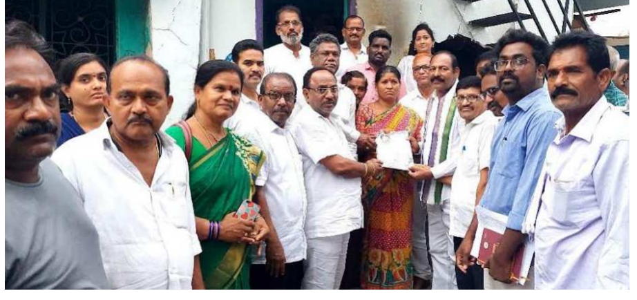
గడపగడపకు మన ప్రభుత్వం కార్యక్రమంలో ఎమ్మెల్యే కంబాల జోగులు

రాజాం (విజయభాను న్యూస్) : పట్టణంలో కన్నా వీధి, బుక్కా వీధి, చిక్కల వారి వీధి వార్డుల్లో మంగళవారం గడపగడపకు మన ప్రభుత్వం కార్యక్రమాన్ని రాజాం ఎమ్మెల్యే కంబాల జోగులు నిర్వహించారు. ఇంటింటికి వెళ్లి ప్రభుత్వం అందించిన సంక్షేమ పథకాలను