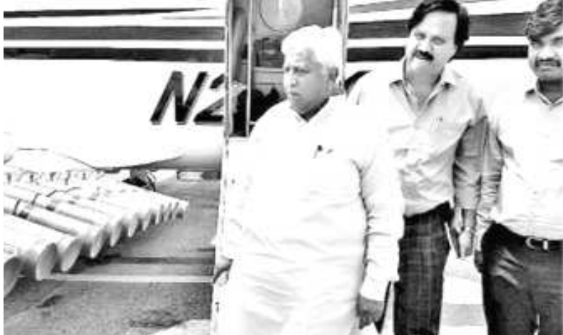
మి.మి. వర్షపాతం నమోదైందని తెలిపారు. కరా?టకల్ వర్షాకాలంలో సగటున 1138 మి.మి. వర్షపాతం నమోదవుతుందని, ఈ ఏడాది ఆశించిన స్థాయిలో వర్షపాతం లేనందున మేఘ మథనాన్ని చేయిస్తున్నామని వివరించారు.