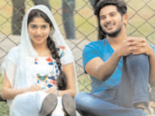
శ్రీ, సంగీతం: గోపీసుందర్, సినిమాటోగ్రఫీ: గిరిష్ గంగాధ్రు, పైట్స్: రాజశేఖర్, జాబ్ బాస్టియన్, పీఆర్ఓ : బియాండ్ మీడియా, ఎగ్జిక్యూటివ్ ప్రొడ్యూసర్: ద్విజ్ శ్రీనివాస్, కో ప్రొడ్యూసర్: వి.చంద్రేష్, నిర్మాత: డి.వి.కృష్ణస్వామి, డ్రస్టింగ్: స్మైల్ లాబ్స్.

సినిమాకు రెండు టైటిల్స్ అనుకుంటున్నాం. పిల్ల-పిల్లగాడు, మైడియర్ భానుమతి. త్వరలో టైటిల్ ఫైనల్ చేసి అనౌన్స్ చేస్తాం. గోపీ సుందర్ సంగీత సారధ్యంలో రూపొందిన రెండు పాటలు తెలుగులోనూ మంచి హిట్ అవుతాయని నమ్మకంతో ఉన్నాం. అన్నారు. ఎగ్జిక్యూటర్ ప్రొడ్యూసర్ దక్షిణ శ్రీనివాస్ మాట్లాడుతూ... షార్ట్ టెంపర్ ఉన్న ఓ కుర్రాడుకి, కూల్ గా ఎప్పుడూ నవ్వుతూ ఉండే అమ్మాయికు మధ్య జరిగే ప్రేమకథ. ఇందులో లవ్ ఎపిసోడ్స్ తో పాటు యాక్షన్ కూ చోటు ఉంది. ఈ సినిమాలో వచ్చే నాలుగు పైట్స్ కూడా నాలుగు రకాలుగా డిఫరెంట్ గా డిజైన్ చేశారు. ముఖ్యంగా హైనే మీద వచ్చే లారీ ఛేజ్ ప్రేక్షకులను డ్రైల్ కు గురి చేస్తుంది. కామెడీ సీన్స్ కూడా సినిమాలో హైలైట్ అవుతాయి అన్నారు. ఈ చిత్రానికి మాట్లాడు భాష్య శ్రీ, సాహిత్యం: సురేంద్ర కృష్ణ, భాష్య