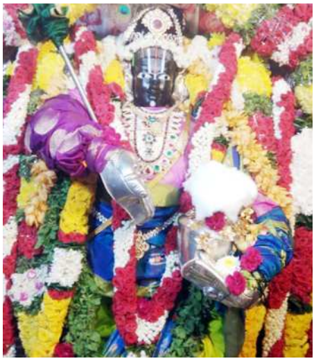
అల్లిపురం: అల్లిపురం వెంకటేశ్వరమొట్టపై వేంచేసియున్న దేవదాయ ధర్మాదాయ శాఖ శ్రీ బలిగిరి ప్రసన్న వెంకటేశ్వరస్వామి వారి దేవాలయంలో శ్రీ కృష్ణ జన్మాష్టమి సందర్భంగా శ్రీ