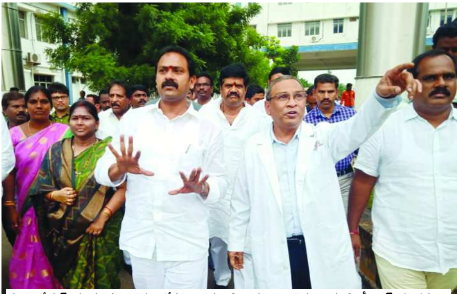
విశాఖలో విమ్నను సందర్శించిన ఆరోగ్య శాఖ మంత్రి ఆళ్ల నాని, బొత్తు, అసంతి శ్రీనివాస్ తదితరులు విమ్నకు సంబంధించిన వివరాలను అడిగి తెలుసుకున్న ఆరోగ్య శాఖ మంత్రి