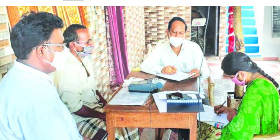
రేషన్ షాపును తనిఖీ చేస్తున్న దృశ్యం

గొలుగొండ : మండలంలో గుండుపాల పంచాయతీకి కొత్తూరు అప్పడు కూడా రేషన్ డిపో డీలర్లపై కేసు సమోదా చేశామని గ్రామం రేషన్ డిపోను గురువారం పౌరసరఫరాశాఖ అధికారులు తెలిపారు.