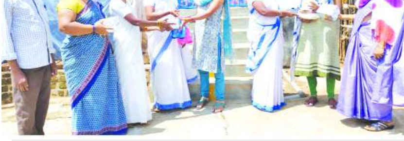
వైయస్సార్ పోషణ కార్యక్రమం

గొలుగొండ : మండలంలో చీడిగుమ్మల అంగన్వాడీ కేంద్రంలో గురువారం వైయస్సార్ సంపూర్ణ పోషణ కార్యక్రమాలు నిర్వహించారు. ఈ సందర్భంగా ప్రభుత్వం పంపిణీ చేస్తున్న పోషకాహారాలను పంపిణీ చేయడం జరిగింది. ఈ కార్యక్రమంలో సచివాలయ సిబ్బంది, అంగన్వాడీ కార్యకర్తలు, బాలింతలు, గర్భిణీలు పాల్గొన్నారు.