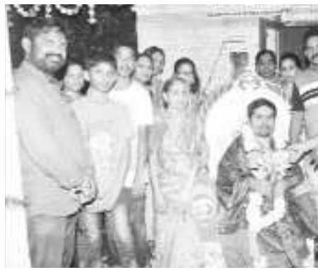
భీమనిపట్నం : స్థానిక చిన్నబజార్ లో దుర్గాఅశ్రమంలో అమ్మవారి సవరాత్రి ఉత్సవాలు గణంగా నిర్వహించారు.