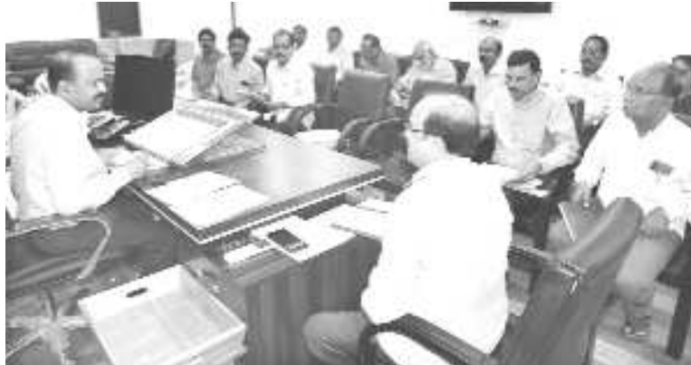
పూర్తిచేయాలని ఆదేశించారు. ఈ సమావేశంలో డిఆర్ఓ సూచించారు. వీటికవసరమైన నిధులను మంజూరు చేయడం జరుగుతుందని, పనులు నవంబర్ 15వ తేదీలోగా పూర్తిచేయాలని ఆదేశించారు.