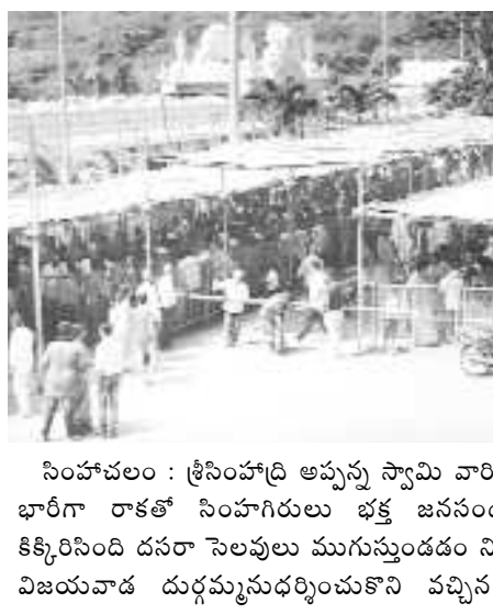
సింహగిరి : శ్రీనివాసాద్రి అప్పస్వామి వారి భక్తులు భారీగా రాకతో సింహగిరిలో భక్త జనసందోహంతో కిక్కిరిసింది.

భక్తులు స్వామి వారికి ప్రధానంగా శ్రీకాకుళం ఒడిస్సా భక్తులు తిట్టి తుపాను తో గతవారం రాత్రున భక్తులు ఈ వారం దర్శనానికి రావడం శనివారం కావడంతో మొత్తంమీద భారీగా భక్తులు అప్పస్వామి దర్శనానికి పోటెత్తారు ఈ దెబ్బకు అన్ని క్యూలైన్లు నిండి పోవడంతో వీరిని అదుపుచేయలేక సిబ్బంది చేతులెత్తేయడంతో రాజవంశం అనంతరం భక్తులకు నీలాద్రి గుమ్మం నుండి లభించుచున్న ఏర్పాటు చేయడంతో భక్తులను అదుపుచేయగలిగారు అధికారుల వివరాల ప్రకారం సుమారు 50 వేల మంది దర్శనం చేసుకున్నట్లు తెలుస్తుంది.