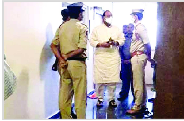
చిన్న వాలెయిల్ తెదేపా రాష్ట్ర అధ్యక్షుడు కింజరపు అప్పారావును గృహ నిర్బంధం చేయడానికి వచ్చిన పోలీసులు