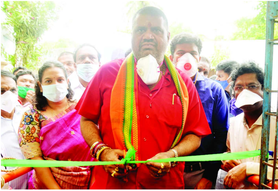
విశాఖపట్నం :- వెంకటాపురం గ్రామ ప్రజలకు ఇచ్చిన హామీ మేరకు, గ్రామానికి చెందిన శ్రీశానవాటిక సంబంధించి 66.00 లక్షల రూపాయల కార్పొరేషన్ నిధులతో