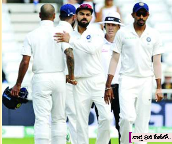
వార్త 8వ పేజీలో..