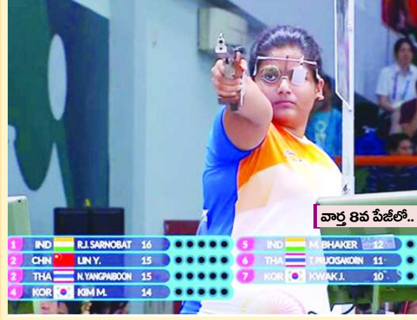
వార్త 8వ పేజీలో..

ఆసియా క్రీడలు.. ఘాటింగ్లో భారత్కు మరో స్వర్ణం