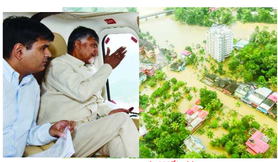
రూ.600కోట్ల నష్టం తూర్పుగోదావరి జిల్లాలోని 45గ్రామాలకు వరద తాకిడి ఎక్కువగా ఉందని, బాధితుల కోసం 16పునరావాస కేంద్రాలు నడుస్తున్నాయని తరువాయి 2లో..

రాజమహేంద్రవరం: ఆంధ్రప్రదేశ్ రాష్ట్రంలో విచిత్ర పరిస్థితి నెలకొందని ముఖ్యమంత్రి చంద్రబాబు నాయుడు అన్నారు. రాయలసీమలో కరవు పరిస్థితులుండగా, కోస్తాంధ్ర ప్రాంతంలో విపరీతమైన వర్షపాతం నమోదవుతోందని చెప్పారు. పశ్చిమగోదావరి, తూర్పుగోదావరి జిల్లాల్లోని వరద ప్రభావిత ప్రాంతాల్లో సీమ చంద్రబాబు నాయుడు బుధవారం హెలికాప్టర్లో ఏరియల్ సర్వే నిర్వహించారు. అనంతరం రాజమహేంద్రవరం విమానాశ్రయంలో అధికారులతో సమీక్ష నిర్వహించారు. సీమలో కరవు.. కోస్తాలో వర్షాలు ఈ సందర్భంగా మీడియాతో చంద్రబాబు మాట్లాడుతూ.. రాయలసీమలో కరవు పరిస్థితులు ఉండగా.. కోస్తాలో భారీ వర్షాలతో వరదలు వచ్చాయని చెప్పారు. రాష్ట్రంలోని ఆరు జిల్లాల్లో కరవు ఉందని, గోదావరి నుంచి 1500టిఎంపీలు సముద్రం పాలయ్యాయని చెప్పారు.