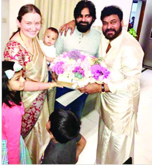
పుట్టినరోజు శుభాకాంక్షలు చెప్పారు. తనను కలవడానికి ఇంటి ముందుకు వచ్చిన చిరంజీవి అభిమానులను ఆప్యాయంగా చిరంజీవి పలకరించారు.