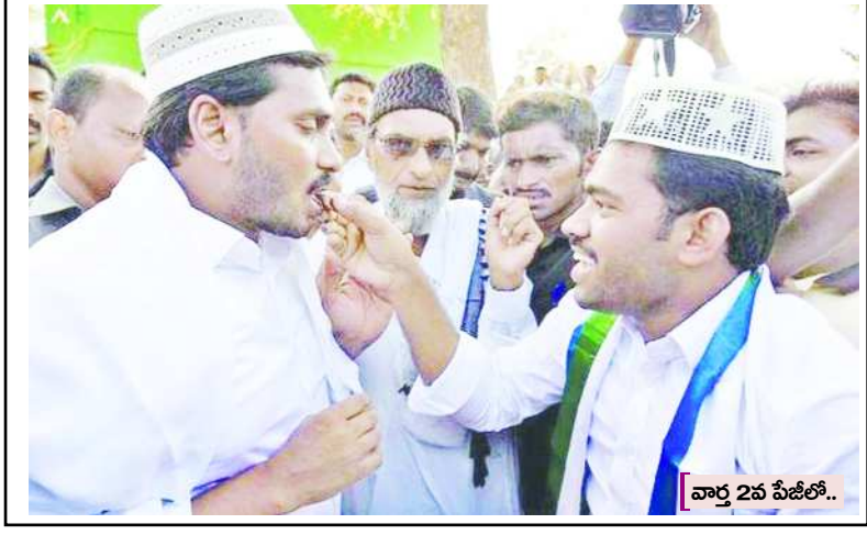
వార్త 2వ పేజీలో..