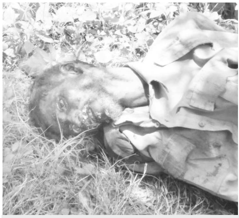
పరవాడ పార్కునీటిలో లభ్యమైన గుర్తుతెలియని మృతదేహం

పరవాడ : మండలం లోని పార్కునీటి టోకంలో సంబంధించిన గ్రీన్ బెల్ట్ లో బుద్ధవారము గుర్తుతెలియని మృతదేహం లభ్యమైంది. దీనికి సంబంధించిన పరవాడ రైటర్ జాన్ కెనడీ తెలిపిన వివరాలు ప్రకారము పార్కునీటిలో టోకంలో సంబంధించిన గ్రీన్ బెల్ట్ కి ఇరవై అడుగులు దూరంలో వున్న ముళ్ళపాడల్లో గుర్తు తెలియని మృతదేహం లభ్యమైంది. మృతుని వయస్సు సుమారు యాభై ఐదు సంవత్సరాలు వుంటాయని అంచనా. మృతదేహాన్ని పొన్న మార్గం నిమిత్తము అనకాపల్లి ఎస్పీఆర్ హనుబట్ కి తరలించారు. ఇ.బోనంగివిఅర్వో పిర్యాదు మేరకు పోలీసులు కేసు నమోదుచేసి దర్యాప్తు చేస్తున్నారు.