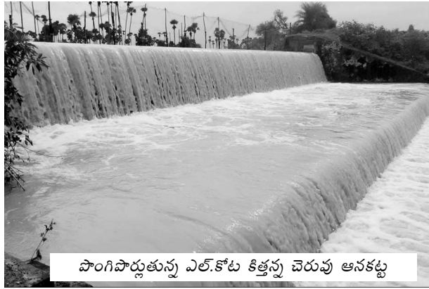
పొంగిపొర్లుతున్న ఎల్.కోట కిత్తన్న చెరువు ఆనకట్ట

లక్కవరపుకోట: ఈ మండలంలో ఈ వారంలో రికార్డుస్థాయిలో వర్షం కురిసింది. దీనితో వాగులు, వంకలు పొంగి పొర్లుతున్నాయి. ఈ మండలంలో ఈ నెల సదరు వర్షపాతం 207 మిల్లీమీటర్లు. అయితే ఈ నెల 24వ తేదీ వరకు 285 మిల్లీమీటర్లు వర్షపాతం నమోదు అయింది. తదుపరి 25వ తేదీన 120 మిల్లీమీటర్లు, 27వ తేదీన 50 మిల్లీమీటర్లు, 28వ తేదీన 90 మిల్లీమీటర్లు, 29వ తేదీన 28 మిల్లీమీటర్లు వర్షం కురిసింది. దీనితో వర్షపాతం సగటును మించిపోయింది. నిన్నటివరకు సరైన వర్షాలు లేక వరి నాట్లు పూర్తికాలేదు. వర్షాలు ఊపందుకోవడంతో రైతులు వరినాట్లు పూర్తి చేస్తున్నారు. జూలై నెలలో సగటు వర్షపాతం 149 మిల్లీమీటర్లు కాగా తక్కువగా 84 మిల్లీమీటర్లు కురిసింది.