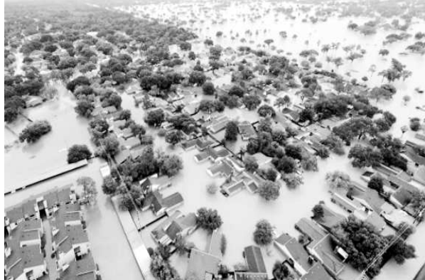
వాషింగ్టన్: హరికేన్ హార్వి ధాటికి అమెరికాలోని హూస్టన్ నగరం చిగురుటాకులా వణుకుతోంది. ప్రజలు ఇళ్లలోంచి బయటకు వచ్చేందుకు భయపడుతున్నారు.