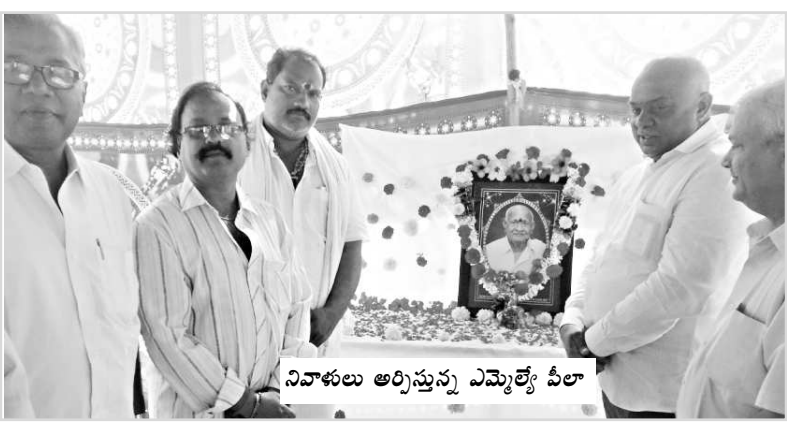
నివాళులు అర్పిస్తున్న ఎమ్మెల్యే పీలా

- 10 వేల మందికి అన్నసమారాధన - 2వేల దుప్పట్ల పంపిణీ