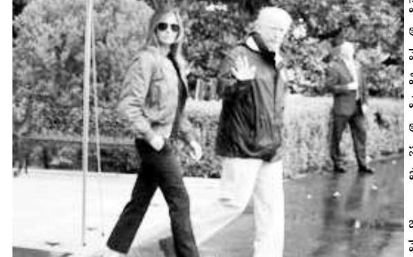
వాషింగ్టన్: వరద ప్రాంతాలను సందర్శించడానికి వెళ్ళిన సందర్భంలో అమెరికా అధ్యక్షుడు డోనాల్డ్ ట్రంప్, ఆయన సతీమణి మెలానియా ట్రంప్ మరీ సోకులకు పోవడం విమర్శలపాలైంది. ఇటీవల తీవ్ర వర్షాలు, వరదలతో చిన్నాదిస్తున్న అయిన డెక్స్‌సన్ ముంగళవారం ట్రంప్, ఆయన భార్య మెలానియా సందర్శించారు. ట్రంప్ హయాంలో అతిపెద్ద విలయంగా భావిస్తున్న డెక్స్‌సన్ విపత్తు నేపథ్యంలో అధ్యక్షుడు, ఆయన సతీమణి