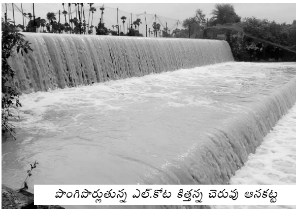
పొంగిపొర్లుతున్న ఎల్.కోట కిత్తన్న చెరువు ఆనకట్ట

లక్కవరపుకోట: ఈ మండలంలో ఈ వారంలో రికార్డుస్థాయిలో వర్షం కురిసింది. దీనితో వాగులు, వంకలు పొంగి పొర్లుతున్నాయి. ఈ మండలంలో ఈ నెల సదరు వర్షపాతం 207 మిల్లీమీటర్లు. అయితే ఈ నెల 24వ తేదీ వరకు 285 మిల్లీమీటర్లు వర్షపాతం సమోదాయం అయింది. తదుపరి 25వ తేదీన 120 మిల్లీమీటర్లు, 27వ తేదీన 50 మిల్లీమీటర్లు, 28వ తేదీన 90 మిల్లీమీటర్లు, 29వ తేదీన 28 మిల్లీమీటర్లు వర్షం కురిసింది. దీనితో వర్షపాతం సగటును మించిపోయింది. నిన్నటివరకు సరైన వర్షాలు లేక వరి నాట్లు పూర్తికాలేదు. వర్షాలు ఉపయోగపడడంతో రైతులు వరినాట్లు పూర్తి చేస్తున్నారు. జూలై నెలలో సగటు వర్షపాతం 149 మిల్లీమీటర్లు కాగా తక్కువగా 84 మిల్లీమీటర్లు కురిసింది.