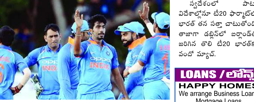
దిల్లీ: పాట్లీ క్రెకెట్లో భారత్ వా హా కొనసాగుతోంది. తొలి టీ20 ప్రపంచకప్ ఫైనల్లో పాకిస్తాన్పై విజయం సాధించి ట్రోఫీని ముద్దాడింది. 2014లో రన్నరప్ గా నిలిచింది.