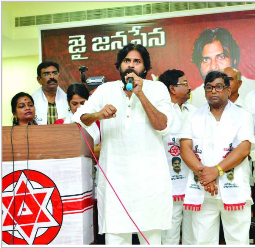
(1వ పేజీ తరువాయి)