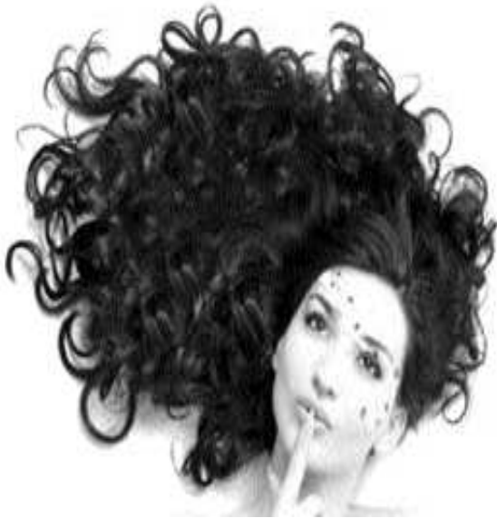
హాయిర్ ప్రొడక్టును మాత్రమే ఉపయోగించాలి.