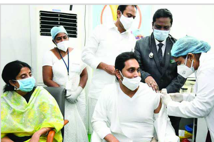
గుంటూరు: ఆంధ్రప్రదేశ్ ముఖ్యమంత్రి వైఎస్ జగన్మోహన్ రెడ్డి కోవిడ్ వ్యాక్సిన్ వేయించుకున్నారు. గుంటూరులోని బారత్ పేటలోని 140వ వార్డు సచివాలయానికి సతీమణి వైఎస్ భారతితో కలిసి వెళ్లిన ముఖ్యమంత్రి వైఎస్ జగన్.. కోవిడ్ వ్యాక్సిన్ తీసుకున్నారు. అనంతరం వార్డు/గ్రామ సచివాలయాల్లో వ్యాక్సినేషన్ కార్యక్రమాన్ని ప్రారంభించారు. సీఎం జగన్ మాట్లాడుతూ.. కేంద్ర మార్గదర్శకాల ప్రకారమే వ్యాక్సినేషన్ కార్యక్రమం కొనసాగుతుంది. మూడు నెలల్లో రాష్ట్రంలో వ్యాక్సినేషన్ కార్యక్రమాన్ని