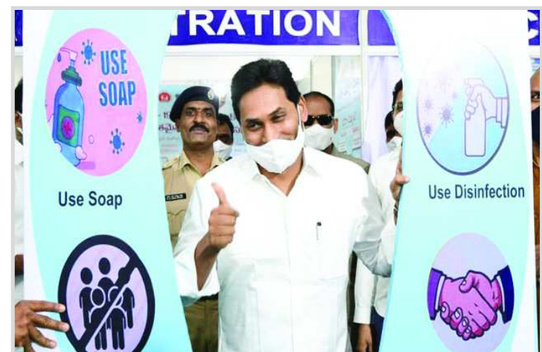
పూర్తి చేస్తాం. గ్రామాల్లో వ్యాక్సినేషన్ పై వాలంటీర్లకు అవగాహన కల్పిస్తారు. ఇంటింటికీ వెళ్లి 45 ఏళ్లు దాటినవారి వివరాలను వాలంటీర్లు దగ్గరుండి సేకరిస్తారు. ఏ రోజు వ్యాక్సినేషన్ జరుగుతుందో ముందుగానే వాలంటీర్లు చెబుతారు. ప్రతి మండలంలోని పీహెచ్సీల్లో వ్యాక్సినేషన్ కార్యక్రమం నిర్వహించనున్నారు. అని తెలిపారు. ముఖ్యమంత్రి వైఎస్ జగన్ వ్యాక్సిన్ తీసుకున్న వ్యాక్సినేషన్ కేంద్రం, వ్యాక్సిన్ రూమ్, అజ్బర్నియేషన్ రూమ్ను సాం మంత్రి మేకతోటి సుచరిత, కలెక్టర్ వివేకయాదవ్ లు బుధవారం పరిశీలించిన సంగతి తెలిసింది.