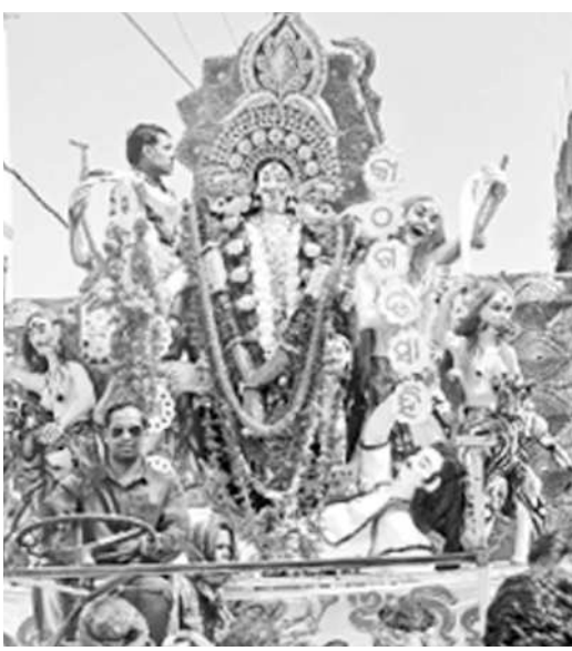
ప్రధాన మార్గాలలో పాటు నిమజ్జనాలు జరిగి ప్రాంతాల్లో సీసీ కెమెరాలు ఏర్పాటు చేసి పరిస్థితిపై నిఘా సాగిస్తున్నామని తెలిపారు.