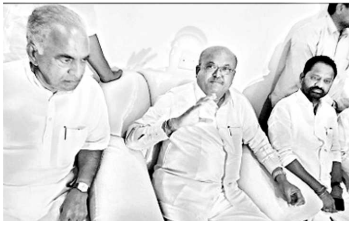
హామీ ఇచ్చారు. టిప్పు జయంతిని భాజపా రాజకీయం చేస్తోందని ఆరోపించారు. ప్రభు త్వం ఆదర్శరంగాలో ఇతర మహా నీయుల జయంతల మాదిరిగానే టిప్పు జయంతిని ఆచరిస్తున్నట్లు చెప్పారు.

య్యాక గడిచిన నాలు గేళ్లలో 24వేల ఉద్యోగాలను భర్తీ చేశామని, ఇందులో హై-క భాగానికి చెందిన 3700 మందికి ఉద్యోగాలు లభించాయని వివరించారు. రవాణా శాఖను లాభాల బాట పట్టించేందుకు, సిబ్బంది జనసేవగా ఉండేందుకు చర్యలు తీసుకుంటున్నామని తెలిపారు. హై-క భాగంలో బస్సుల సంవార వ్యవస్థను బలోపేతం చేస్తామని, ప్రయాణకులకు సరిపడే బస్సులు నడుపు తామని చెప్పారు. 9లక్షల కిలోమీటర్లు తిరిగిన బస్సులను మారుస్తామన్నారు. రాయ చూరు జిల్లాకు ఓల్డ్ బస్సు నడపాలని డిమాండు ఉందని, త్వరలో సమకూరు స్తామని హామీ ఇచ్చారు. టిప్పు జయంతిని భాజపా రాజకీయం చేస్తోందని ఆరోపించారు. ప్రభు త్వం ఆదర్శరంగాలో ఇతర మహా నీయుల జయంతల మాదిరిగానే టిప్పు జయంతిని ఆచరిస్తున్నట్లు చెప్పారు.