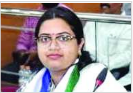
మేయర్, డిప్యూటీ మేయర్లకు నియమిత పత్రాలు అందజేత